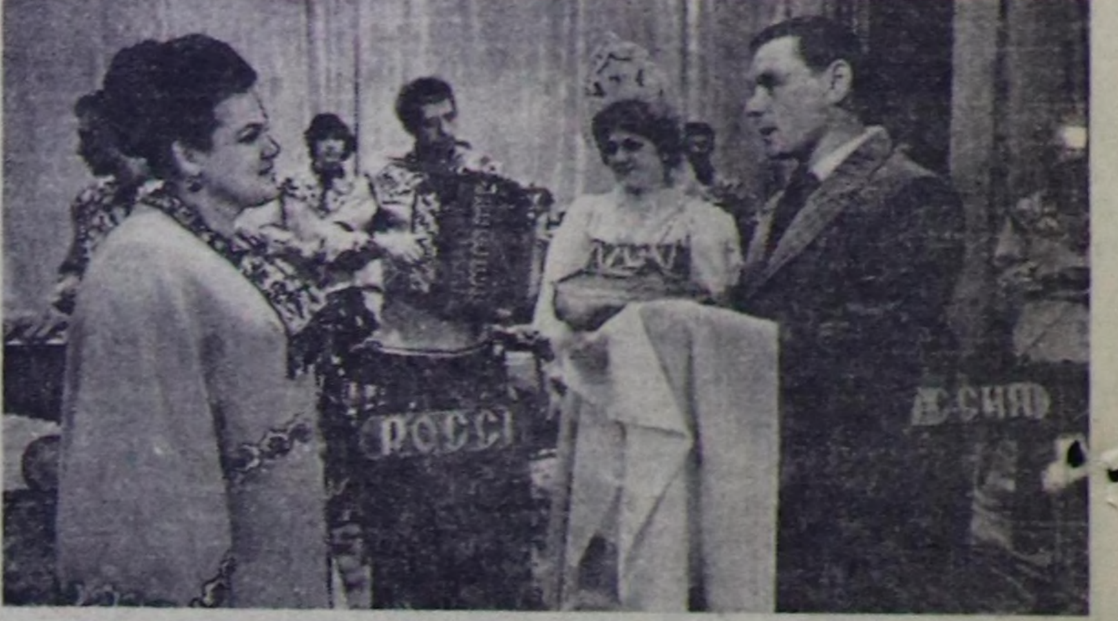
Ярославль облдаста көдөңчөң чаамак апарган «Ярославльдин хаяазы» дээр уран чүз фестивалы бооп турар. Ипп муң аяк артистер ол фестивал үезинде механикаторларга, тараажыларга, малчыларга оон көргүзсөр...