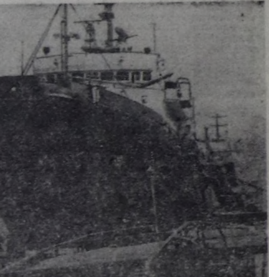
ГДР. Балык тудар шитип чорупу «Призвание» деп баазаны (чуртук) совет балык тудар флотун толээкчилеринге дамчыткан берген. «Атлантик» деп улуг траулерге демейлеп, Штральзундагы судно тударынын кылганы бо суднода тусунай өвөөгө класстары бар, ычанганш ову өвөөгө судноду кылдыр база ажылап болур.