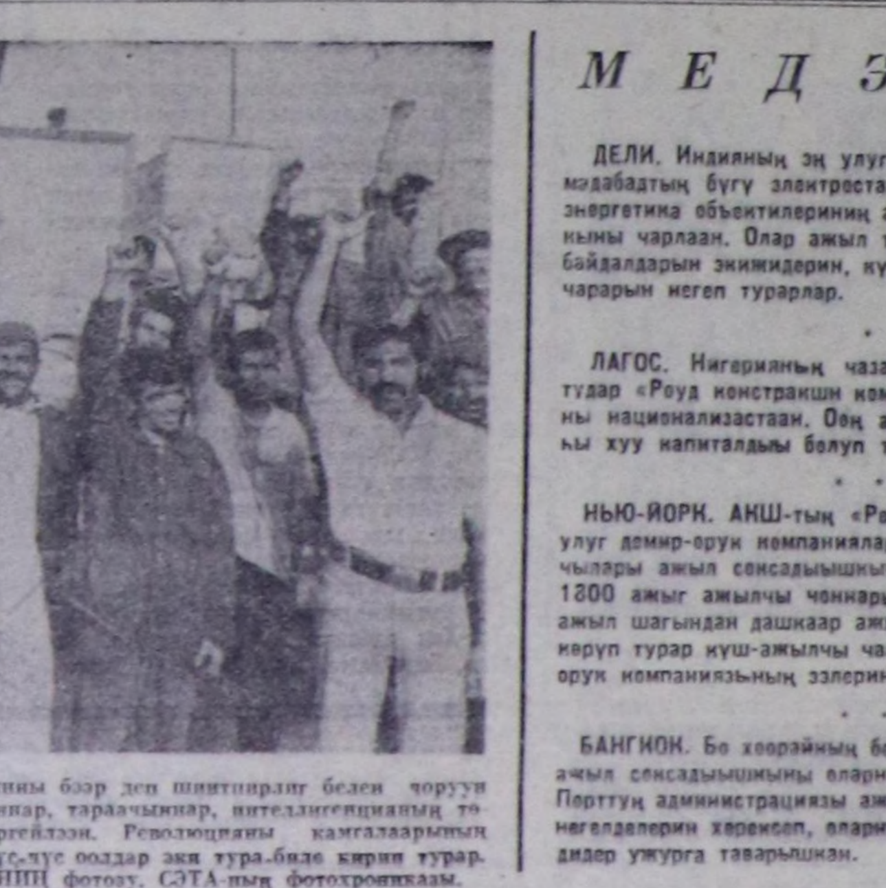
ойтүр шавышыны бээр деп шийтирилди беан чорун муну ахыччылар, тараччылар, ителдигеишанын төлөөкчилери кирегиелээ. Революцияны казгалары комитеттерини чүр-үс оодар эки тура-биле кирип турар. Г. НАДЕЖДИНИЦ фотоу, СЭТА-ның фотохроникасы.

Аэрофлоттук «Ил-62» дээр рейс самолөду үш ахыг холуу оодаланыш-биле август 28-те Нью-Йорктан Москвага утаалдыр ужудул үшкен. Америк эрге-чавырлар делегей эргелик чорутуу нормативтерини куду көрүшпаш, совет самолөттү, оон 112 пассажирин болгаш экипажтын 11 жөжүгүн Ке-ленди аттыг аэропортка 73 чурттык такта хоруталга турган.