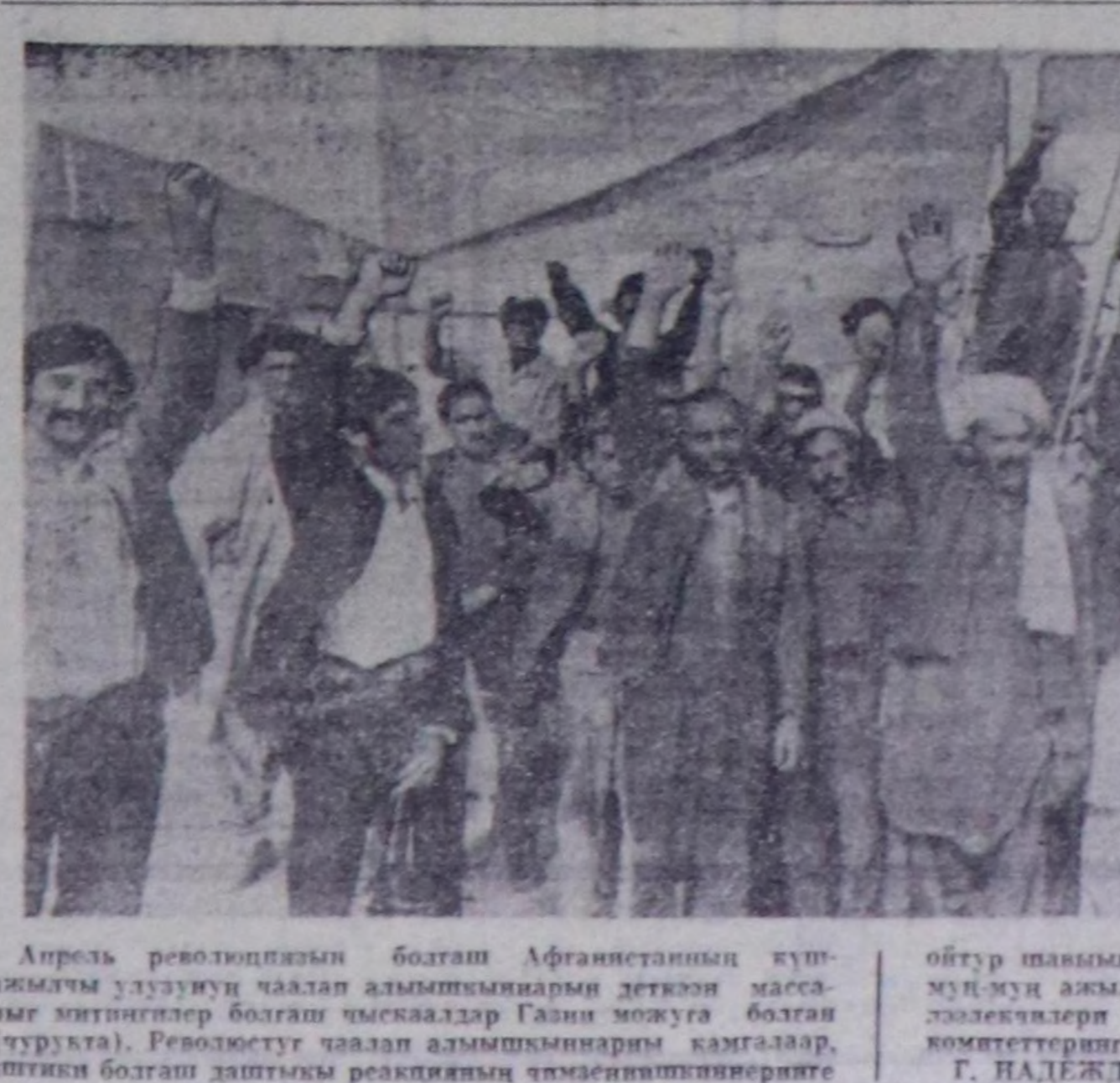
Апрель революциясын болгаш Афганистанды кун-ахчыч удузуу чалаан алышыны ахын делегейинде болгаш чымылдар Галин мөкүгү болгаш (чурттуу). Революстун чалаан алышыны казгалар, иштиги болгаш дагыгы реакцияны чымыштырынгыте

КАБУЛ. (СЭТА). Афганистан удузу-биле эп-сеткил каттыштырылыгы делегей конференциясы болууч ахын Кабулда доокан, ону Тайбыныч Бүгү-делегей Чөвүлелини инициативанын өзүлөр чымылары эртерген. Барык 60 чуртта болгаш делегей организацияларынын 100 ахыг делегат алаа кирди. Делегейин ол шулаганын делегаттарынын арасына Совет Эвипелинин, Болгариянын, Польшанын, Германия Демократтык Республиканын, Англиянын, Эфиопиянын, АШШ-тын, Канаданын, Великобританиянын, Франциянын, Индиянын, Ирактын, Кипрдин болгаш өске-даа хей-хөй чурттарынын төлөөкчилери турган.