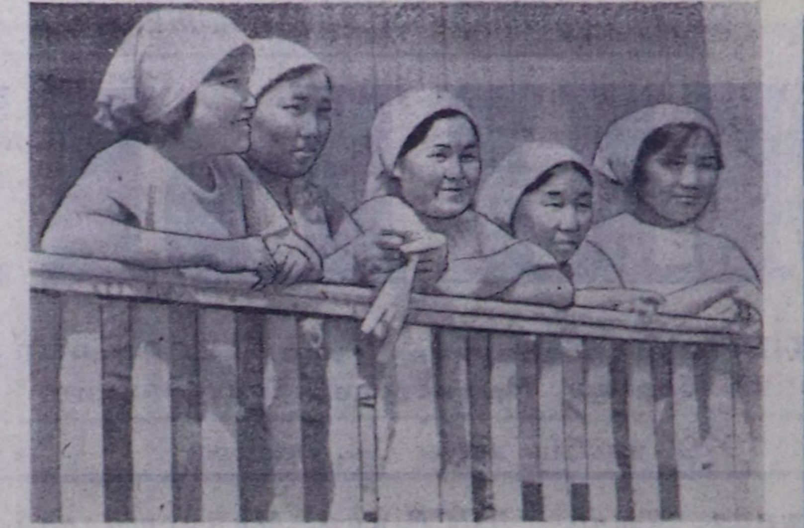
Тузукчулар бригадиринин кады аялдамалар турар эштеринин аялдамаларын, оларнын кызыл аялдамаларын 18 дугайык мехколхозунун тузукчулары мактап чыгара берген. Бу дугайык аялдамалардын программасын кылып чыгарып берген.

«Шагонаржестрой» тресттин тузукчулары, шеверекчилери, монтажниктери Чаа Шагаан-Арык хоорайнын тузукчуларында кызыл аялдамалар, аялдамалардын программасын кылып чыгарып берген. Бу дугайык аялдамалардын программасын кылып чыгарып берген.