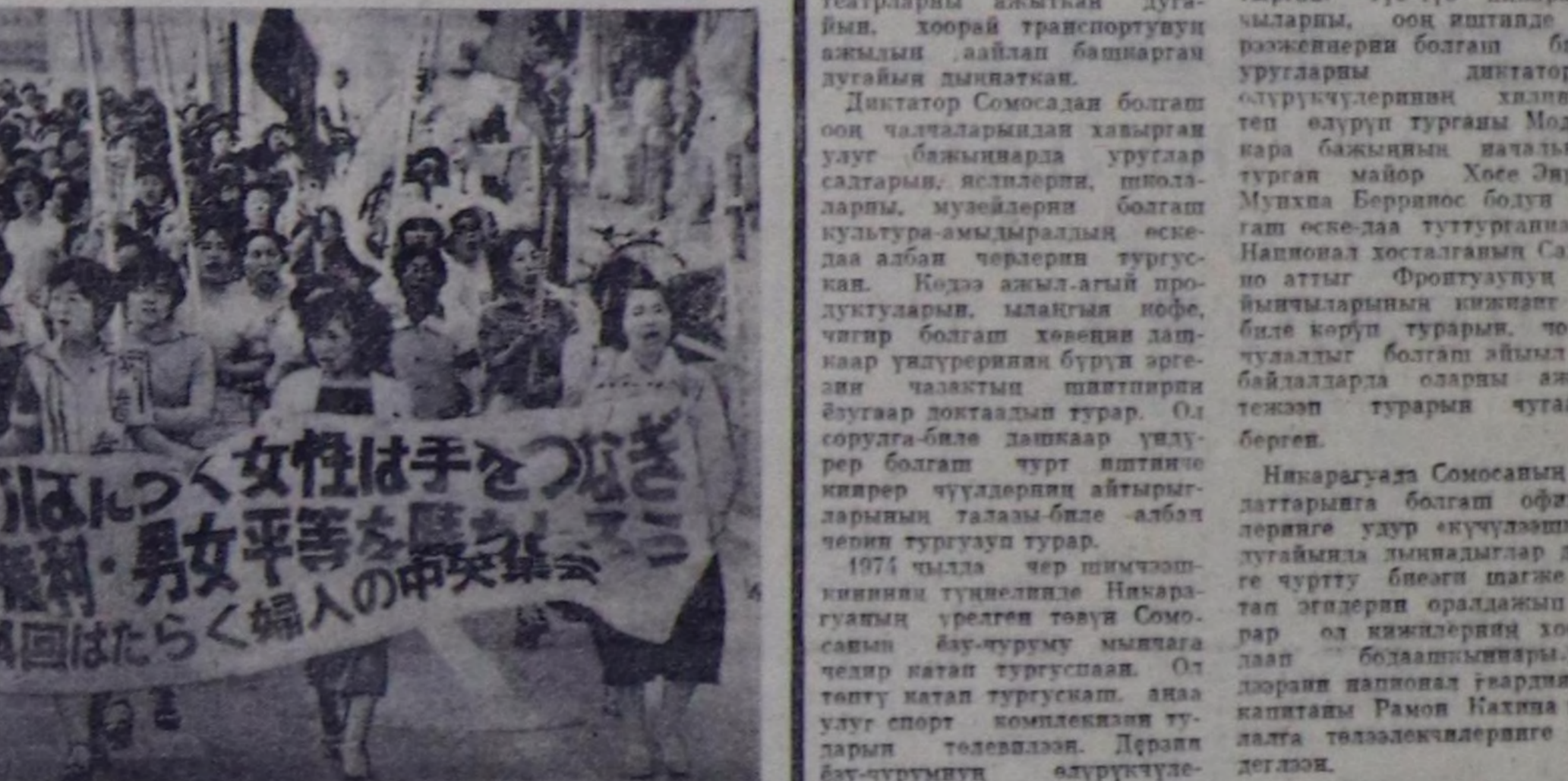
Социал-экономиктиг эрге дээр дискриминацияга уур япон херээженер боттарынын демиселин ургучулешпаан.

МПЛА ТК-нын Топ контроль комиссиянын материалдары болгаш түнелдерин пленумун киржиктирер чугаллашкан. Ол комиссиянын хунералы бо пленумун муруну чарында болган. Ош киржиктерин партиянын чыгыс эвинече база тодаргай политиктиг шүгүмүн амылап кылдырыны чугаллашкан, массалар ортузунга идеолоттук ажылды улам ыңай идепкей-жилерин, партиянын иштиги амылдамганын устата быжылдаттыган норма-чиктерин хун бурунун практиканыга боттаандыраарын, ыңайлап ол норма-чиктерин үрзөр чоруктары болурус дээр шиктирергич демиселди чорударынын эргекер чугулашычче улаштырган.