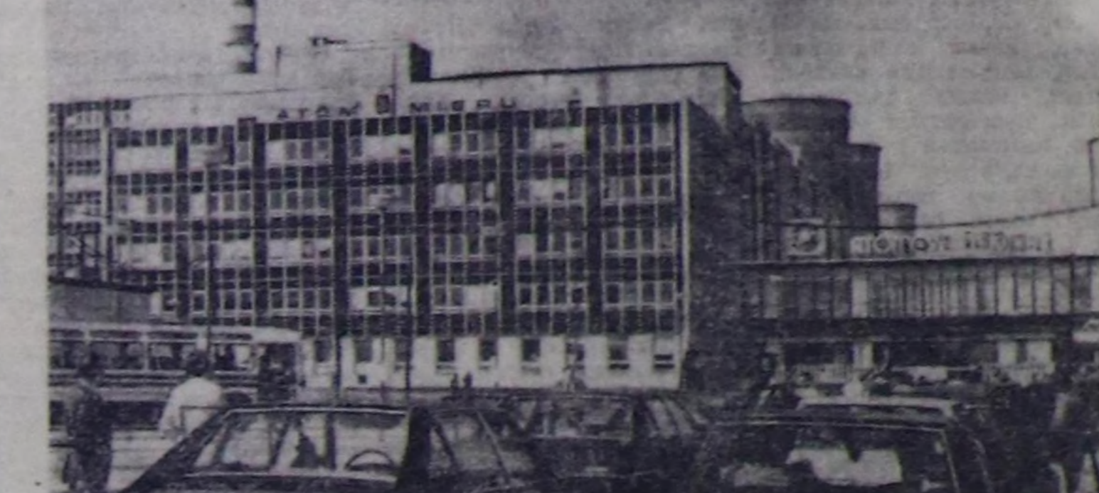
ЧЕХОСЛОВАКИЯ. Яслески-Богунци районда «В-1» деп атомнуг электростанцияны туудуң чехословак-совет найырал тууду деп аап турат...