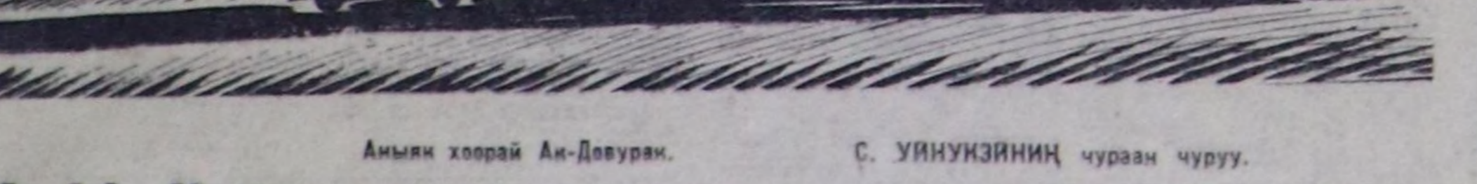
Амын хоорай Ан-Довуран. С. УИНОУЗНИЦ чуран чүруу.

Днепропетривск п и я «Правда» созу аттыг за-водуң кылган вагонар кылды үндүрүрүң дептин төлөөлө күчүзү хуула-лаан. Бугурагенин өн жеди-кенинде тудугулар-нын кирген үдү уугу— тудугу олар планда кер-дүңгөнүн 3 ай өтө доорукан. Ол шымын аялжы — чаа элекшоник аялжы чедил аян-дыган. Белорусиянын тудугуларын үлгериле беле оларнын украин өн-нүктөрү чармштык объек-тин аялжыларга беле кылдыр хуулаатты.