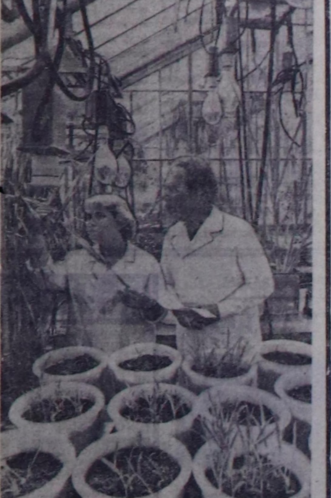
Ленинград 30 миллион рубль—үнүшөр камгалалынын Бүгү-эвилел эртем-шинчилел институтунун коллективинин онгу беш чылда бүдүрүлгө эртем сайыралаан шингээткенинден кирген экономикалык магалдыл мындыг болуп турар. Көлдө ажал-агыт култураларын хоралакчылардан болган аарыгдан камгалалы-биле эртемдеринин ажалдап кылып турары комплекстик хем-чеглер болган биологтур аргалары үнүштерин бедик дүжүткүр болган шыдамык сорттарын өстүрерине дуадыт.