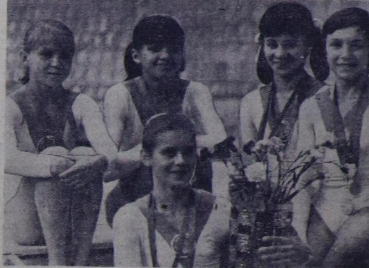
Спартакиадаың Гимнастика талазы биле болган маргылдазыңа РСФСР-ниң шилиндеги командазы тилкели болган.