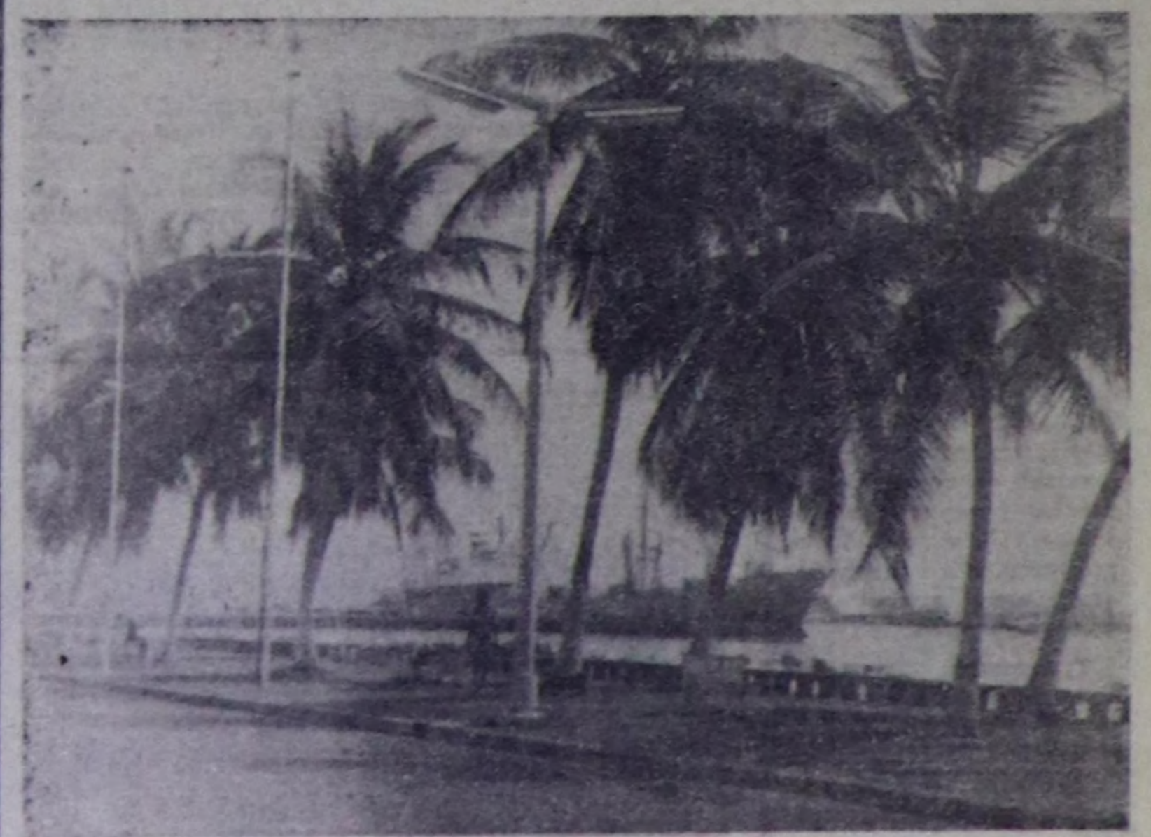
Гвинея-Бисаууну чөну эиенемиканы недүрөнгө, национал чангыс экин быныгыларын, өрөдигалени болган културалы хөгүдөргинге инеску чедининин чөдип алган.