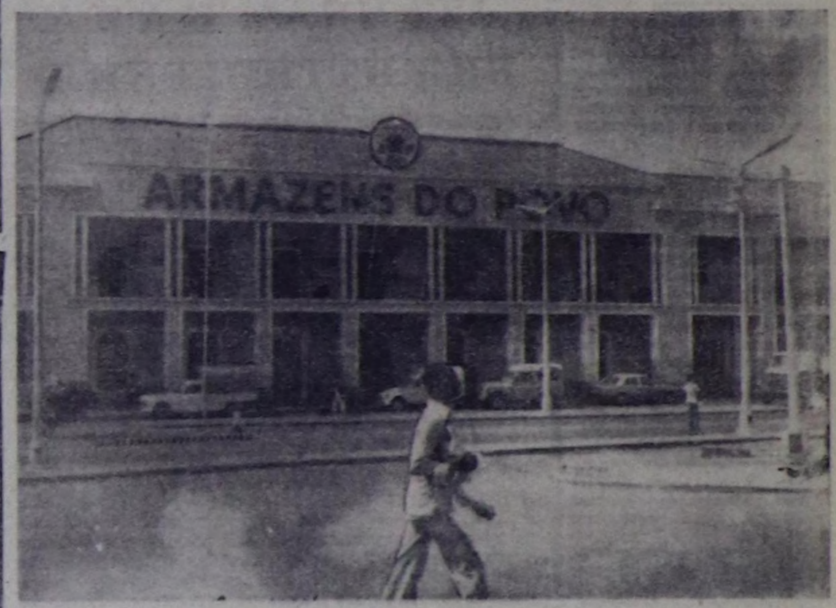
Португал аылдан очулдуруга «Улусчу магазиннер» дээн «Амарзенш ду лаву» дээн бинигилелди Бисау ургүлү көрүп болуу (чурукта). Хамаарышпас чорук дээш чөпсөтүг дөмөйлөшк чылдарында-ла тыптып келген ол магазиннер садига күрүнө соткорууну болбушан, чөнүкү өртүзүндө калбак сугаргмаан.