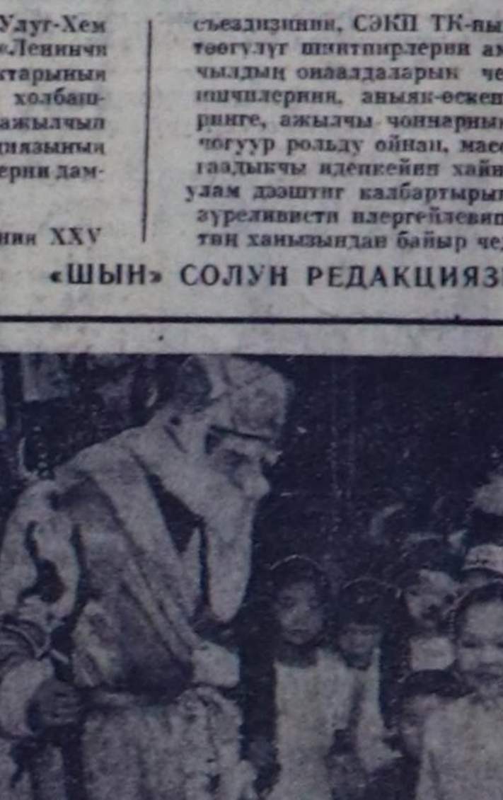
Чая чыдың Елказы, Соок-Ирей — кырган-ачай, Экиш, экиш!