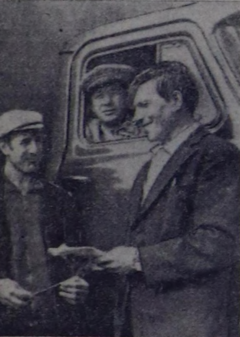
А. ЗАЙЦЕВИЦАНЫН ФОТОЛАРЫ.