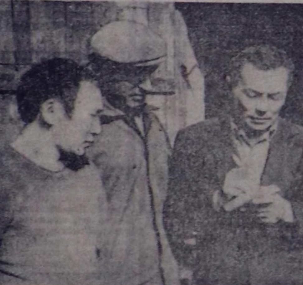
Тайды районунун «Коммунизмдин херел» совхозта ууусуу контроль бодуу...