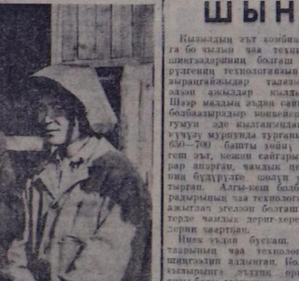
Барыш-Хемчиктин партиязге органингарынын ууусуу контроль бодуу...