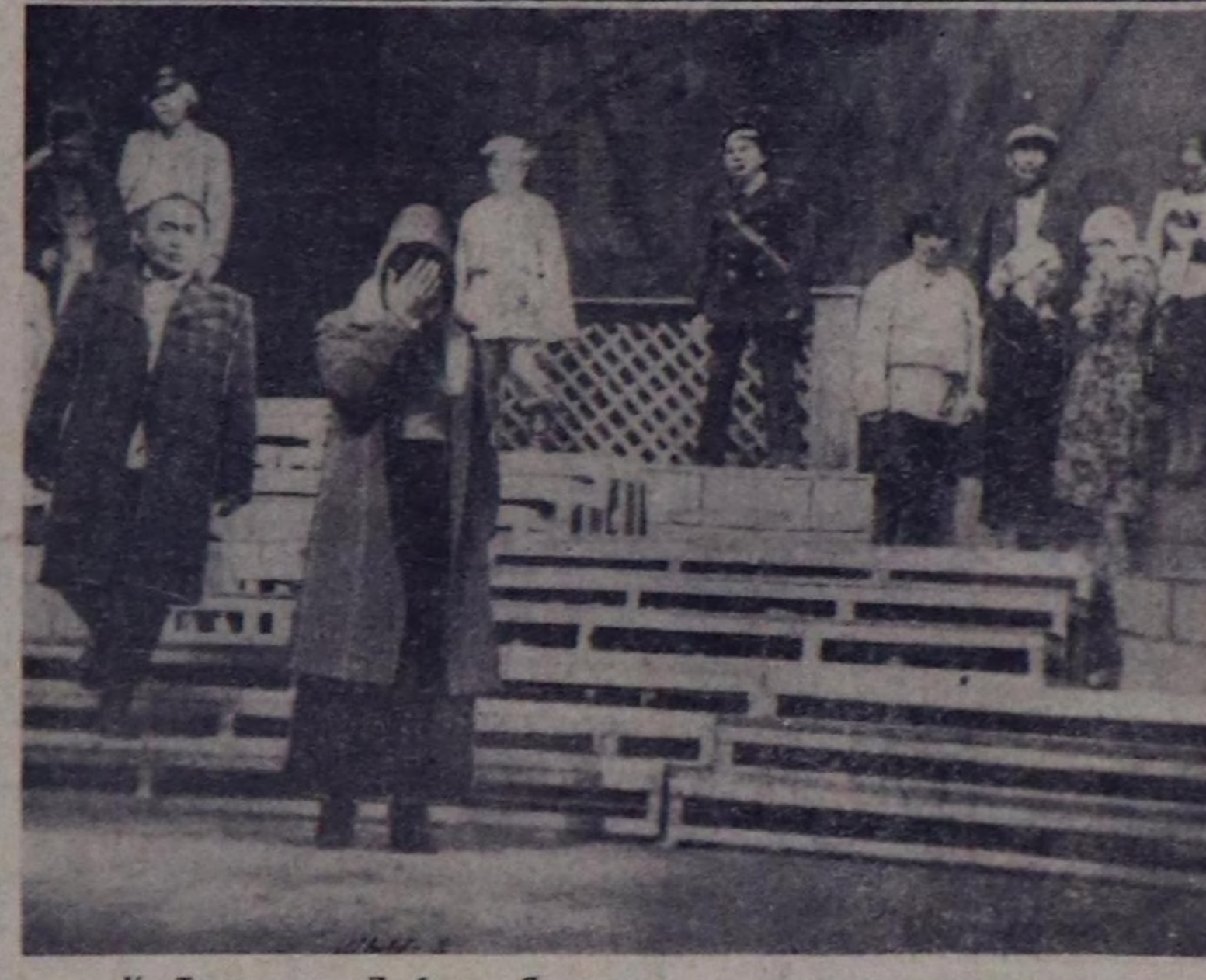
К. Треневтин «Любовь Яровая» деп шилниден көргүзүлгөр.