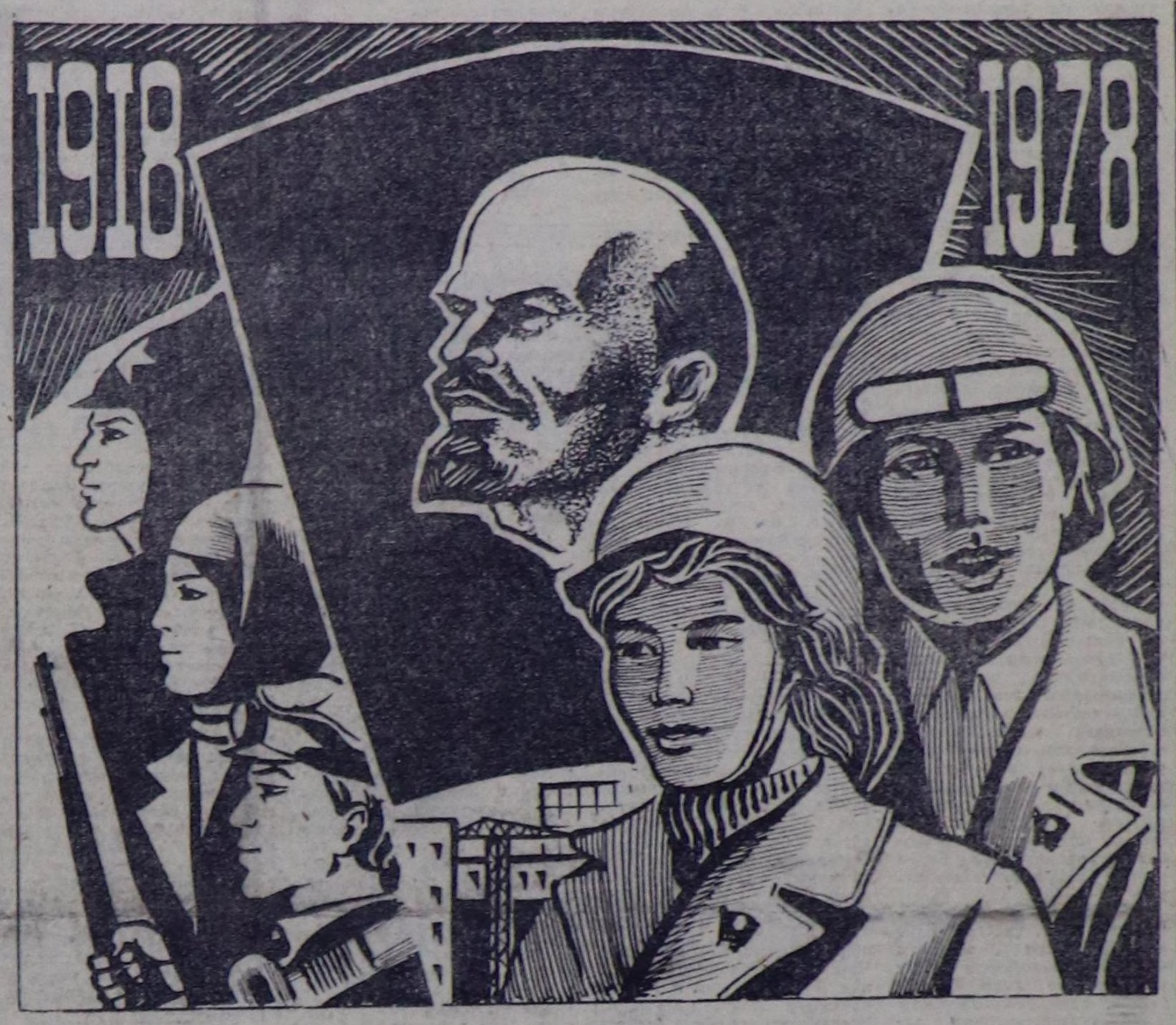
С. САРЫГ-ООЛ. Тываның улустуң чогаалчызы.

Совет Эвилелиниң Коммунисттик партиязының Төп Комитеди