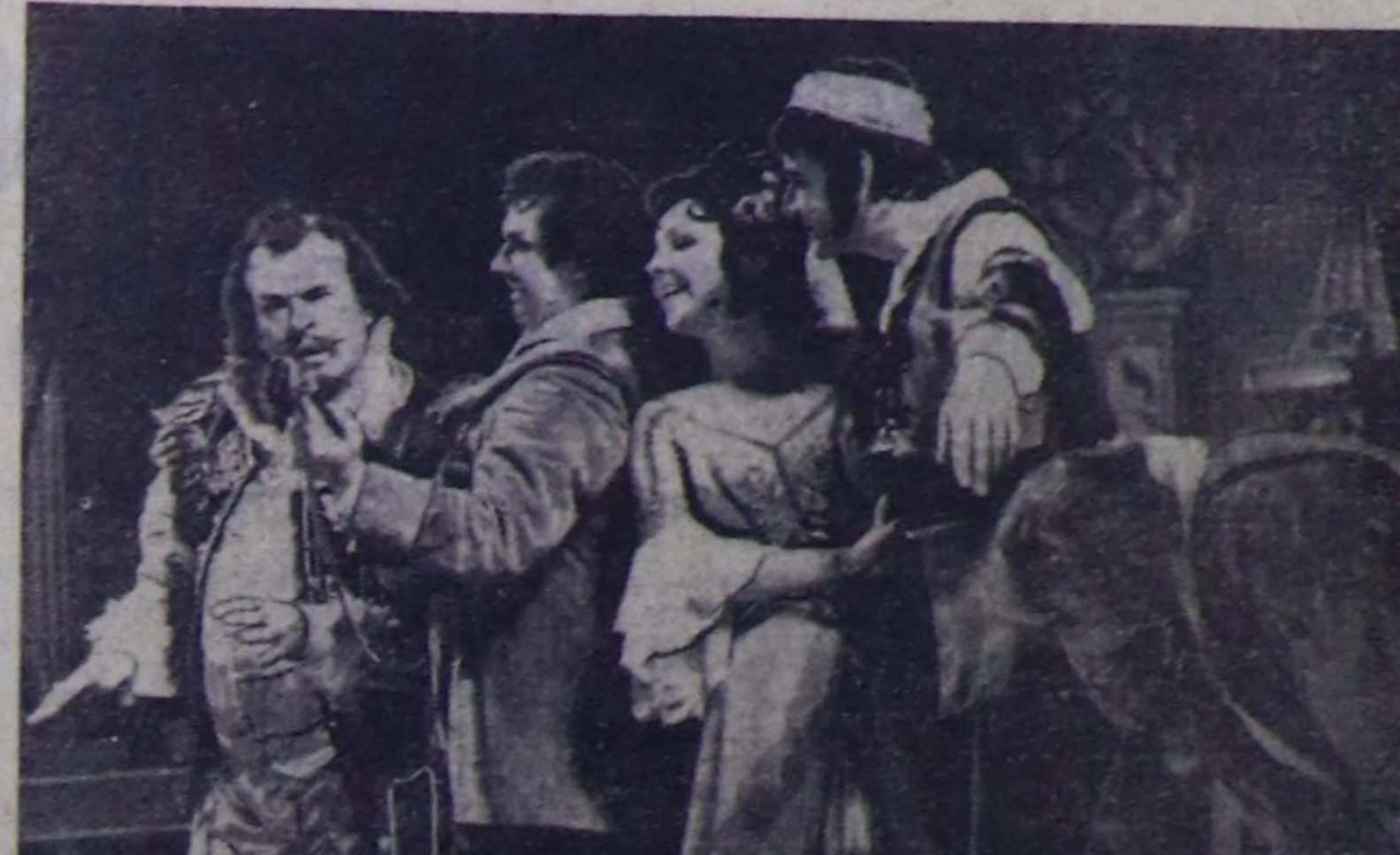
МОСКВА. ССР Эвилелиниң Улуг театры ат-сураглы француз композитор М. Ра...