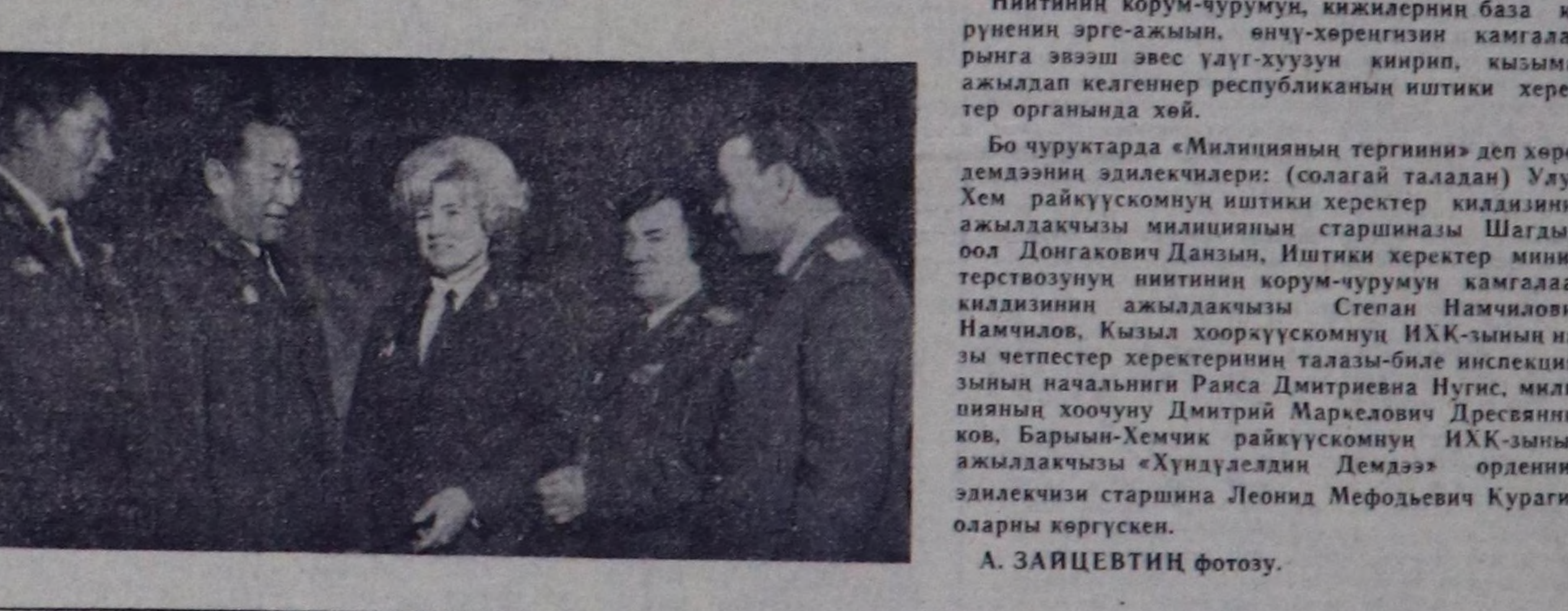
Иштинин корум-чүрүмү, кижилерин база күрүнени эрге-ажыны, өнчү-хөргөнгөн камгалаарына эвэш эвес улут-хууун кирип, кызымак амылдап келгенер республиканың иштиги херектер органында хой.

Совет хоолдуу-дүрүмү сактыры, социалдык ниити хүндүткөн дүрүмүнү күндүлөп көрү, шынчы болгаш ак сотиндык болгаш уруулар кижидиге-диге дугайында сакты сактымын, социалдык өнү-хөргөнгөн сактымын база төтөгөлөр чоруктар-биле демисел, ниитиле удуру үндүдери эрте-көйө кире-керттир.