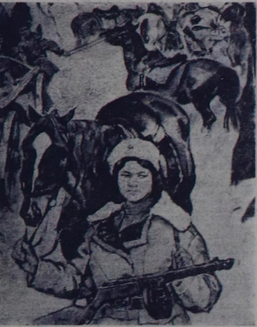
МОСКВА. ССРЭ-нин Чепсектиг Күштеринин 60 чылдыг тураскааткан «Маадырлыг 60 чылдар» деп уран чүү делгелгези Төл делгелге залында ажыттыган.

ЧУРУКТАРДА: чурукчу Д. А. Налбандянын «Бичин Чер. Новороссийск» деп чуручу; чурукчу В. С. Кравченкоун (Киев) «Партизанныр лагеринде» (Ковпактын шериг кезээнин партизаны К. Войцехович) деп чуручу.