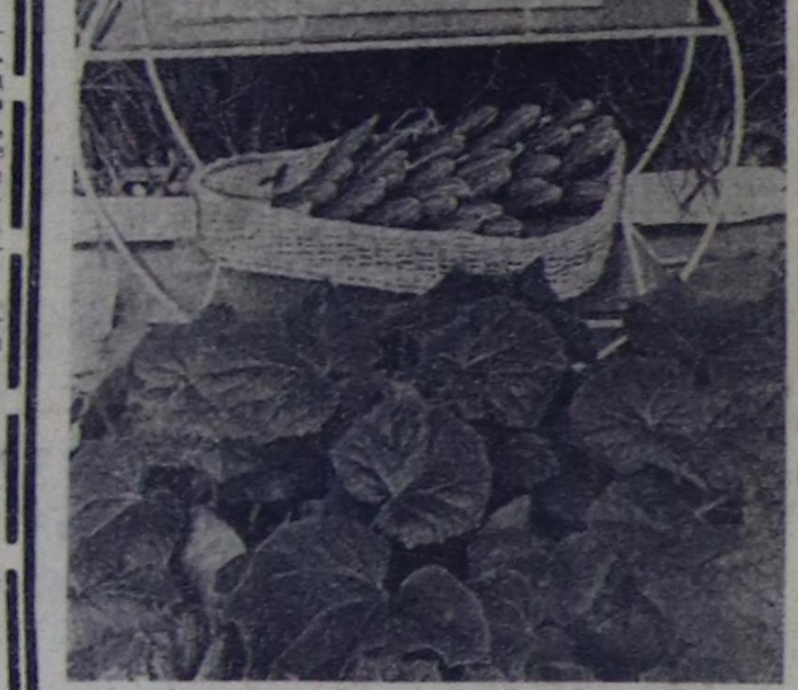
ЧУРУКТА: «Матвеевский» совхозтун стейдиз. Бетинде-огурецтер рассадым.

Красноярскиниң аян-чорук бирозу биле Тываның эскурелаян бирозу кады бо чылдын Красноярсктен Дулика чедир Улуг-Хемден экиндилериниң организастаар. Олар Сибирянын каас-чараш бойдузун соңуургаар. Оон аңгыда туристер Совет эрге-чагырганы тургузар дээн демгелекчи чораларын шолутурун турган черлерин көрдөр, аптаа хүнүнүң чуртун соңуургаарлар.