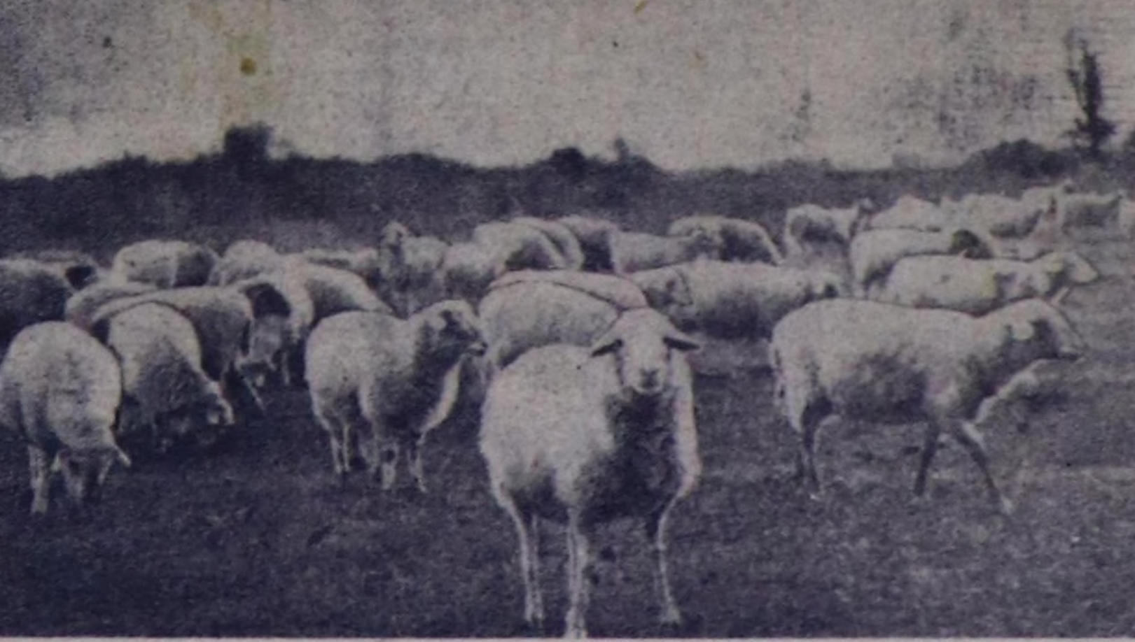
Мурнакчы малчын ону беш чылдың шалычы үшкү чылыңың кыштагашкынын база чедишиниң эртеринг болгаш амыг үдөс хоюн эки өдөр-белчириң черде чайлагалдып турар.