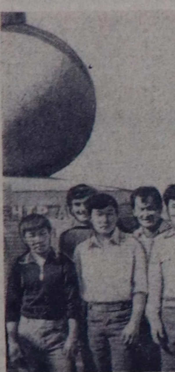
ЧУРУНТА: Хабаровск крайның мөгалери Азия дилтин географтыг төвүн көргүскөн тураскаалдын чанына.