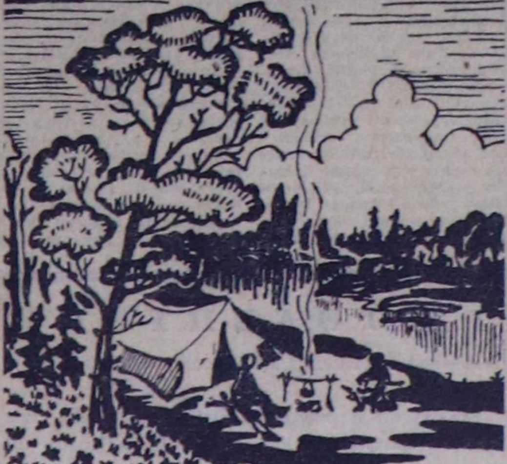
Арыг агаар бөлдө казы Арыг иштин хөргө келген. Майкыг канканын, шайгыг ташыг.

Март 31-дө үгөш «Шын» солууга баодатылган чайнвордун харымы: 1. Ирвун, 2. Сякы, 3. Майган, 4. Натуралд, 5. Төсө-кудуру, 6. Узлар, 7. Ракса, 8. Кадыр-Ос, 9. Саары, 10. Геоденс, 11. Таскы, 12. Лоцман, 13. Нон-Хол, 14. Ловина, 15. Арт.