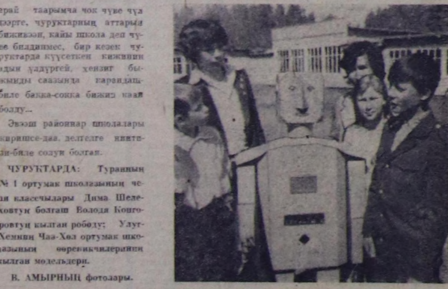
арай таарымча чок түгө чүгө дөргө, чуруктарыг аттарыг бажыккан, кайы шкоча деп чүгө-биле бажыккан, бир кеек чуруктарыг күүсөткөн кызыккан адми удуруч, хөйгөг бажыккан биле бажыккан бажык кан болду.