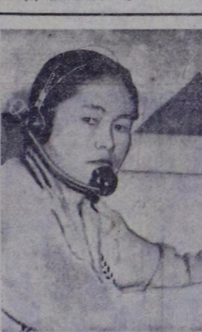
Бай-Тайга районунуң харылаза б.лдириниң телефонизи коммунисттик аял-шыялчызы...