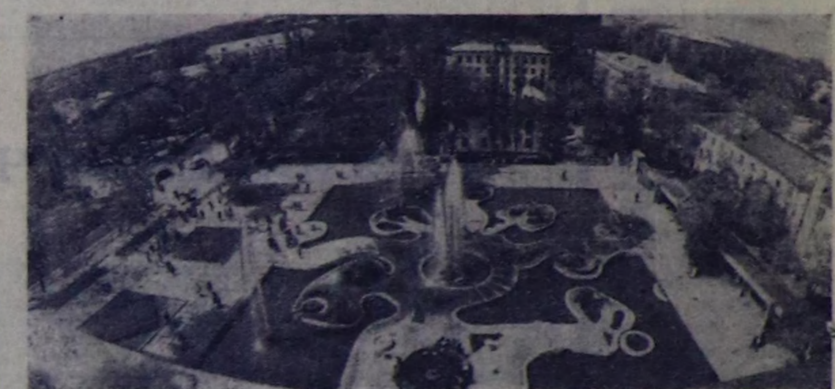
Дөрт дакпыр орденниң Киргизиянын наймасында Фрунзе хоорай бодунуң 100 чыл оон дөңдөкөргөңө белеткенип турар. Хоорайның кызыгаары чыл үгөн турар.

Правда май 31-ни таанып-лаарыңа удуз демисел хүнү кылдыр чаралан. Ону эрттиринеңе белеткел планын өзүңаар чуртуг калды камгаал министрествоу тааныпчы чорашыңиң дугайында муң-муң плакаттарын, сузуарыңиң үндүргөн.