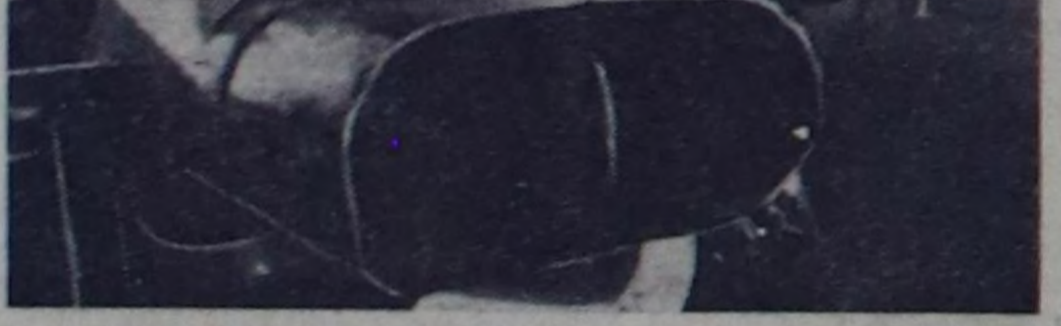
ЧУРУКТАРДА: (үстүндө) аъттың наряд, хайгаарал черинде, ленинч ком-натта.