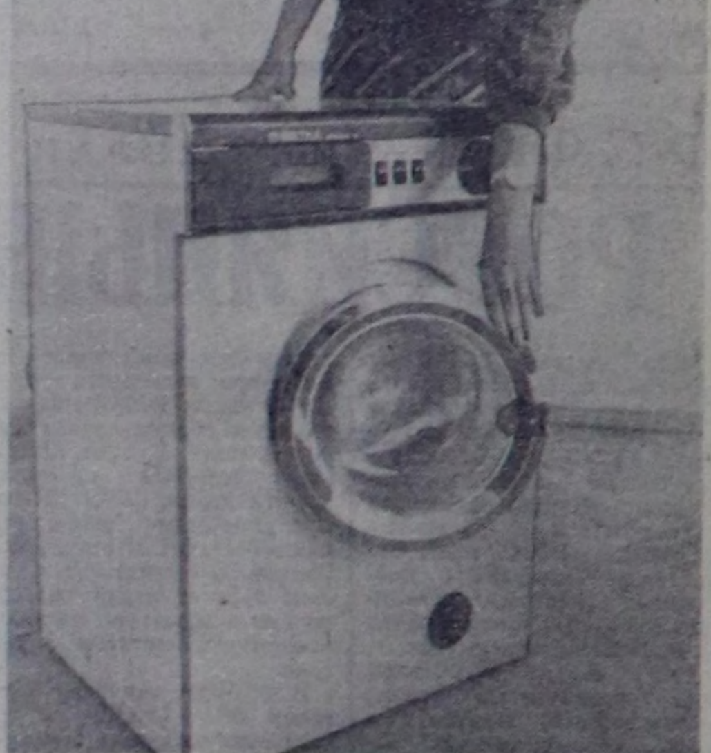
КНЕР. Чоннуң амыдыралыга херектеер машиннар болган приборлар бүдүрер талаам-биле Бүтү-өншөлдөң арыг-шөвөрчү кижиляр чон кымыраарын чөвөр хире херилерин амыкдан кылган.