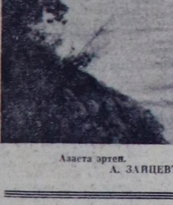
А. ЗАЙЦЕВИНА фотожурду.

Китөөдөр ийи шакта доостур. Оналгалары ады шака челир кылдыр. А оон сонда бөлүмнөр аялгы эргелер, чай чок-ла турган чүе. Маалданага А. Дажы-Торук, гитарага, ламбоге, итлге, бырааныча А. Очур, чадалага Б. Шириндини бажыларымыс эки ойнаар турганар. Олар пога билбес-даа болза, кууш-биле дилеп алган аялгаларына ол дораан доктур.