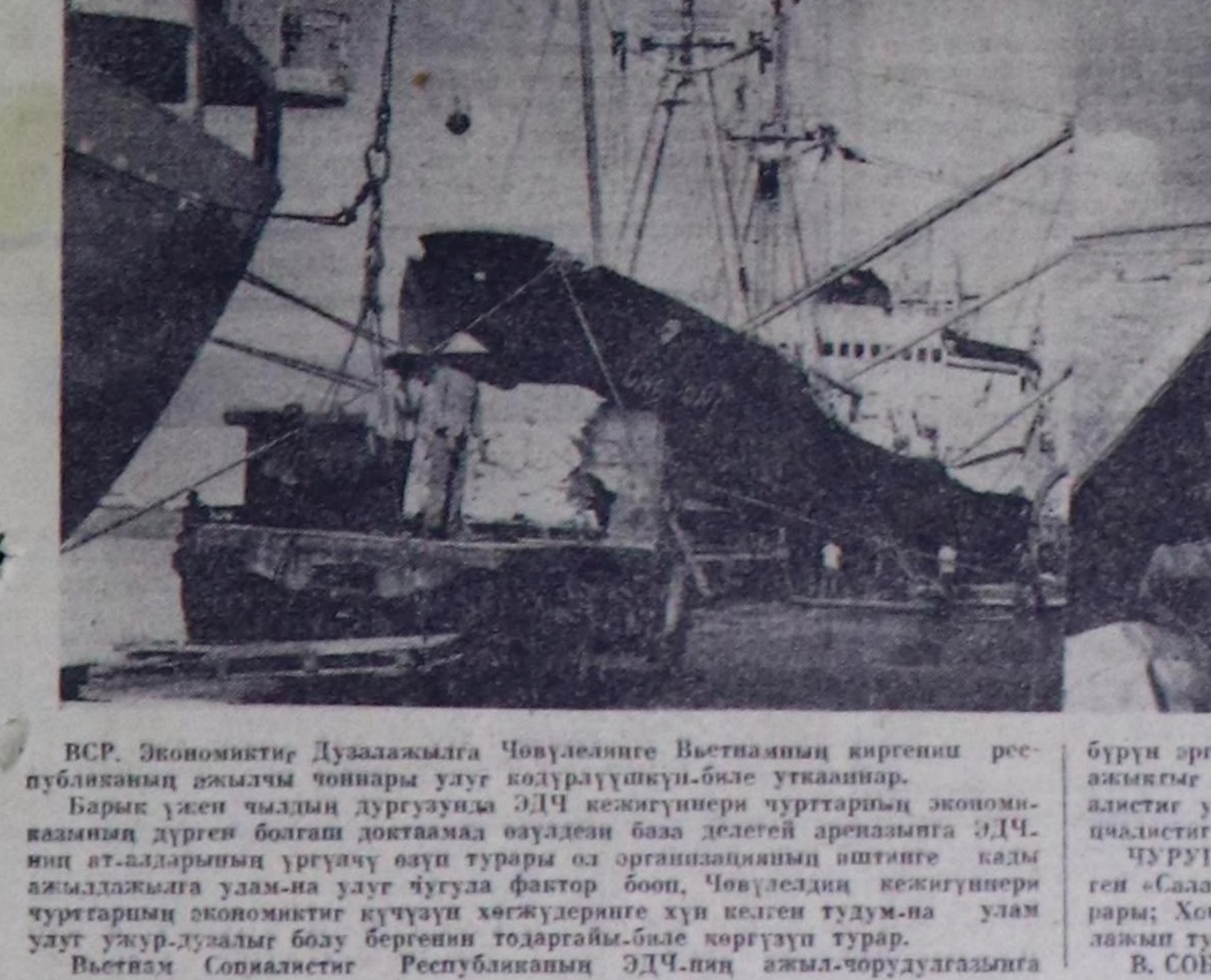
ВСР. Экономикте Дуалажыга Човулаанге Вьетнамын киргенин рес- публиканын ажилчаны чонлары улуг кодурушкуну-биле утааланар.

бүрүн эргенге кесижүгү болуп кырыни бар турар аргалары улам-па ажыкты ажилдарына немедде таарымчалы байддалары тургузар, соци- алистг улуг бугурулелерге чуртун бурунгар шынчылыгы болгон со- циалистг индустриализацияны аргам боар.