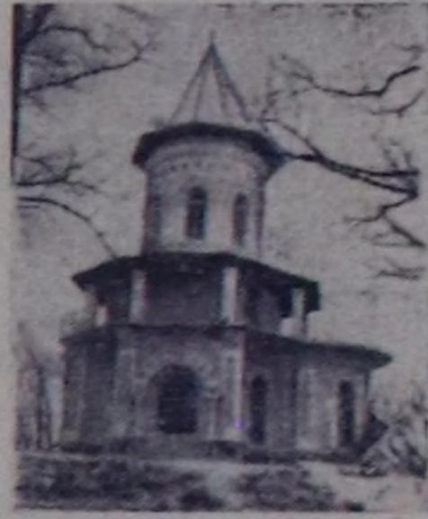
ЧУРУКТАРДА: Шмаковнада ССРЭ-ниң 50 чылы аттыг курорт...