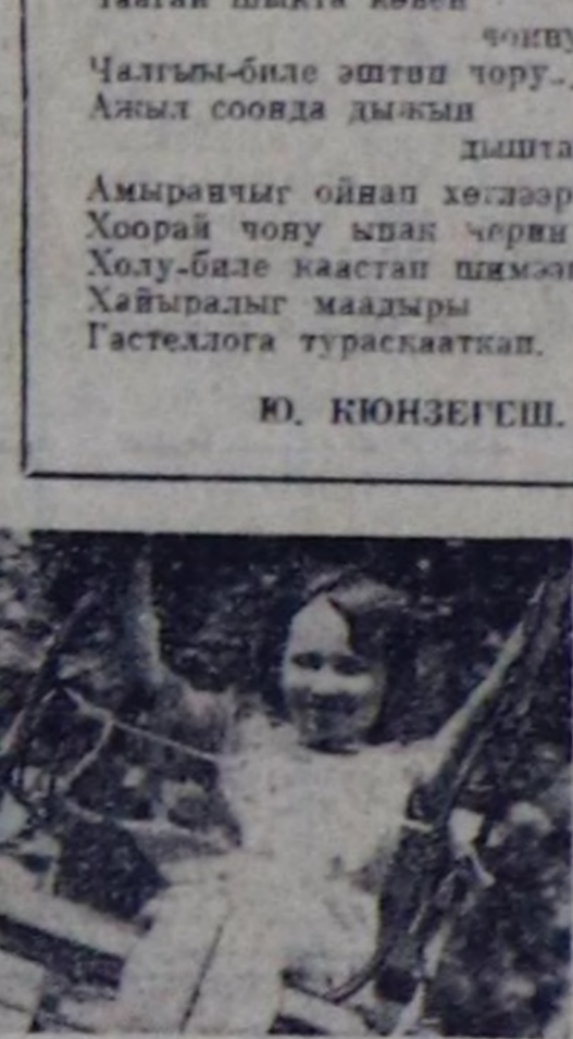
Н. Гастелло аттыг парки культуруг дыштанылга үезинде.