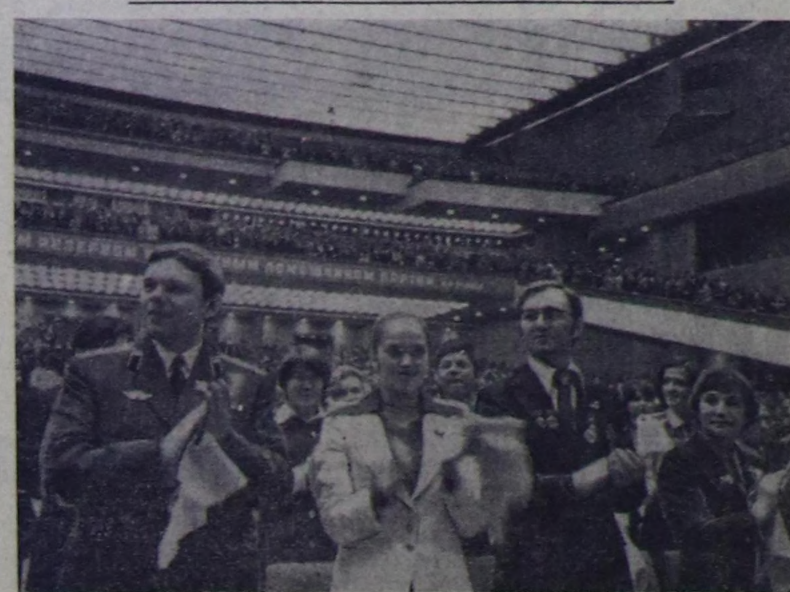
МОСКВА. ВЛКСМ-ниң XVIII съездинин.

Апрель 26-да Кремльдин съезди-лер ордузунга ВЛКСМ-ниң XVIII съездизи ажылы ургучулээн. Де-легаттар ВЛКСМ Төп Комитетинин болгаш комсомолдун Төп реслиян комиссиянык отчөттарын чугаа-лажып турар. (СЭТА)