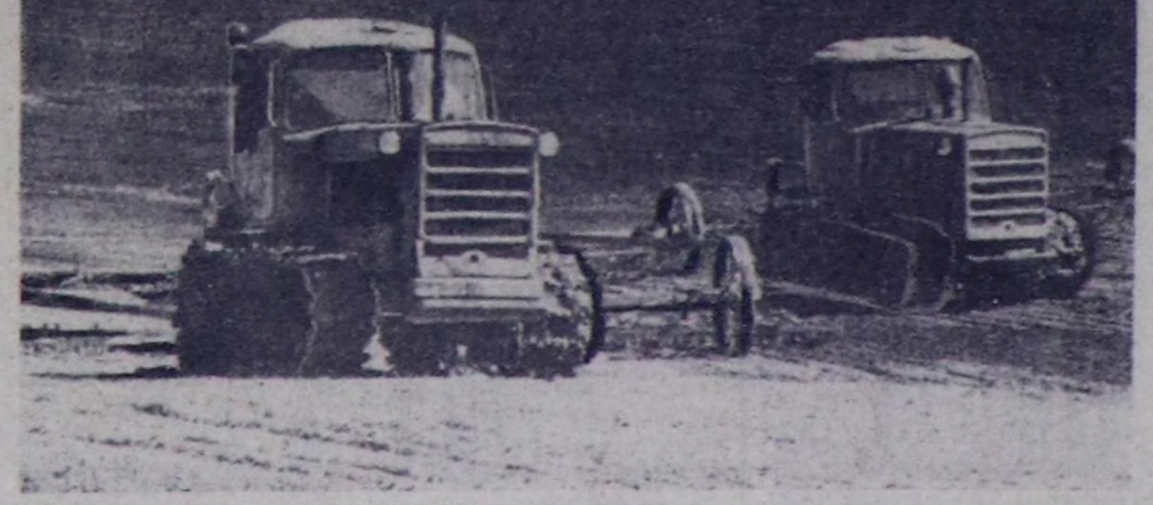
Кара-куу база катан кара...

Районда шык базырышкыныга болгаш кирген «Улуг-Хаяла» совхозунуң механизаторларынын ажыл-иши-биле таңаарга дөш ичаар халтывыс. Оруктун онгула-чыгала чок акци-даа көчүгү. Биче болгаш бир баалыкты ажа халды бээр-инише мурнувуста — «Улуг-Хаяла» совхозтун тарас шөлдери. Дилдиктең аңдарган дес-килей илтирпек каан тарас шөлдери ырактан көргө, бир эзы оңагай каас.