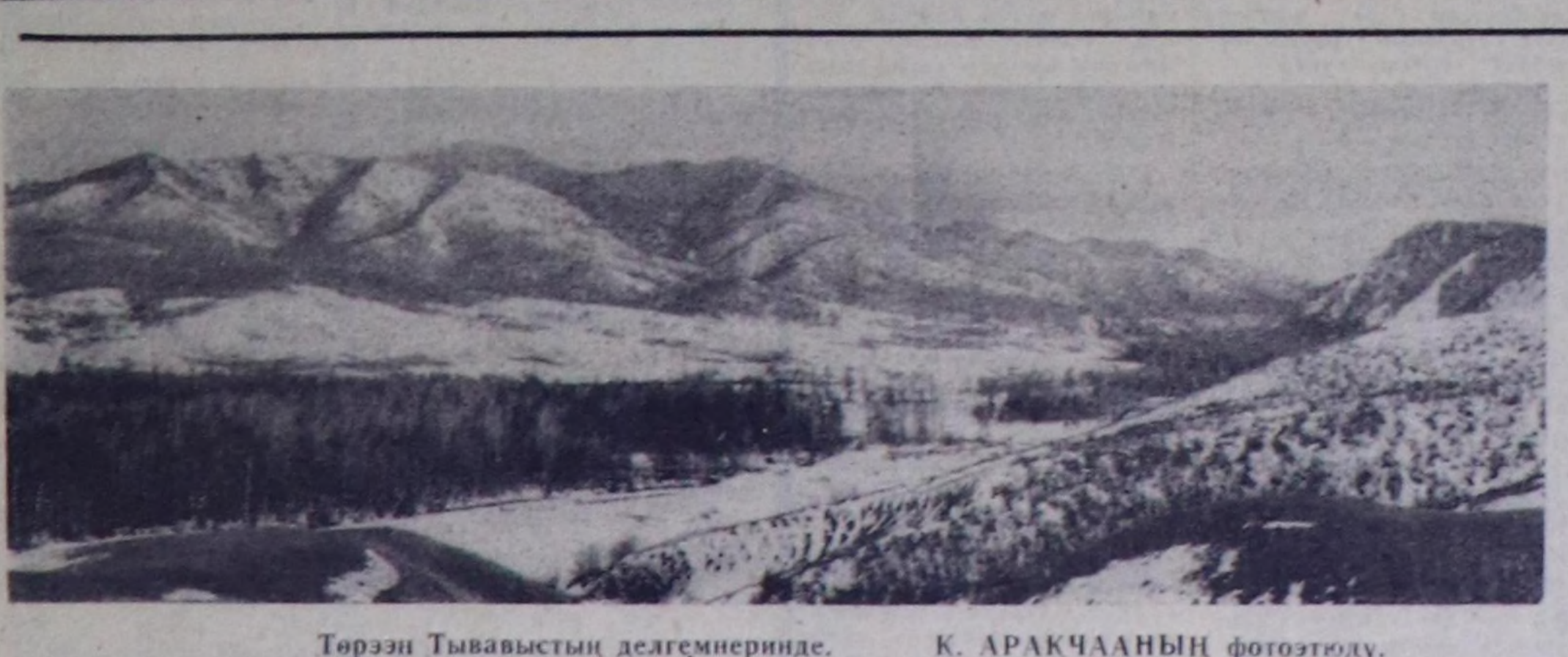
Төрөзи Тывавыстың делгемнеринде.

СССР-нің, Болгарияның, Венгрияның болгаш Чехословакияның араанга чорудар «Олимпиаданың делегей спортлотоу» деп лотерейаны бирги тарылышың 1978-жылдын апрель 15-тен садып эгелээр. Олимпиады онларынныц эгелээрине чедир шупту сестерини артырар — кырыкка чыг чурттарың найысылда-рыга ээлчештер (бирганы—100, 19-га Москвага болур), 49 номерден алдыны тылар жукурау лотерейаны тираж: «Интервеншен» система дамыштыр тускай тее-дамчыдыдыла көпүтүр. «Олимпиаданың делегей спортлотоу» нарточкаларын сатышканды ирген иш-шаша түнүгү 50 хуузу үш муң-дан ол муң рубль чедир ашша ойнаашканын база Москва эртер Олимпиады ойна-рыныц чыдык маргылдааларын көөр туршкн нутевка-лары болгаш өскө-даа ойнаашканын тээрерине баар. Ол дугайын «Олимпиада-80»ның оргкомитетинде ашы эрткин нараалка конферен-цияныга дыпкаткан. (СЭТА-ның корр.)