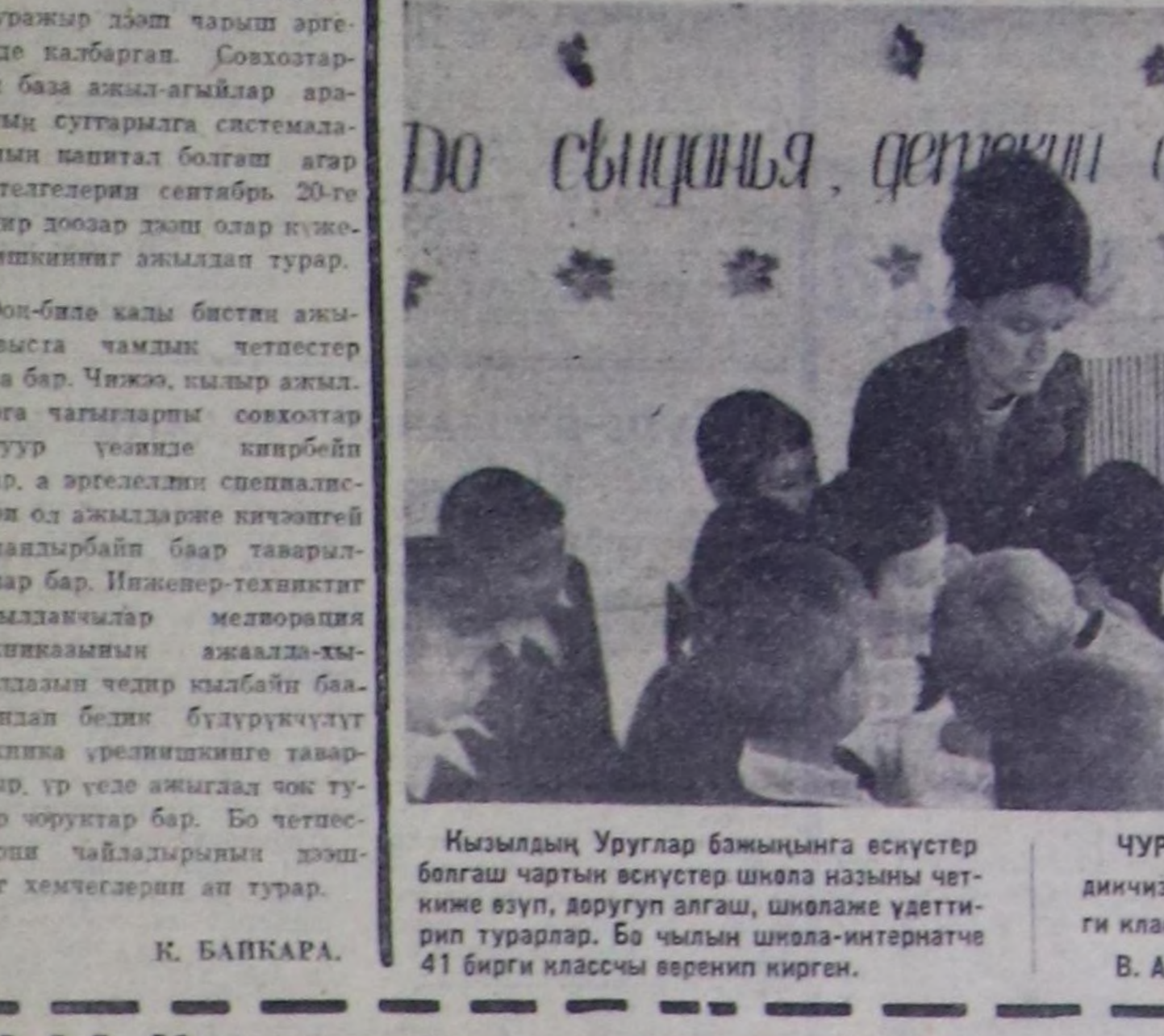
Кызылдың Уруглар бажынынга өскүстөр болгаш чартын өскүстөр школа назыны четкине өзүп, доруугу алгаш, шонлага удегити турарлар. Бо чылын школа-интернатче 41 бирги классчы өрөнгөн кирген.

Шежинин Чолдог-Кара-Суг. Чайны ортан айы. Илп-дип, олт-сиген холбосоник чыгы-кан.