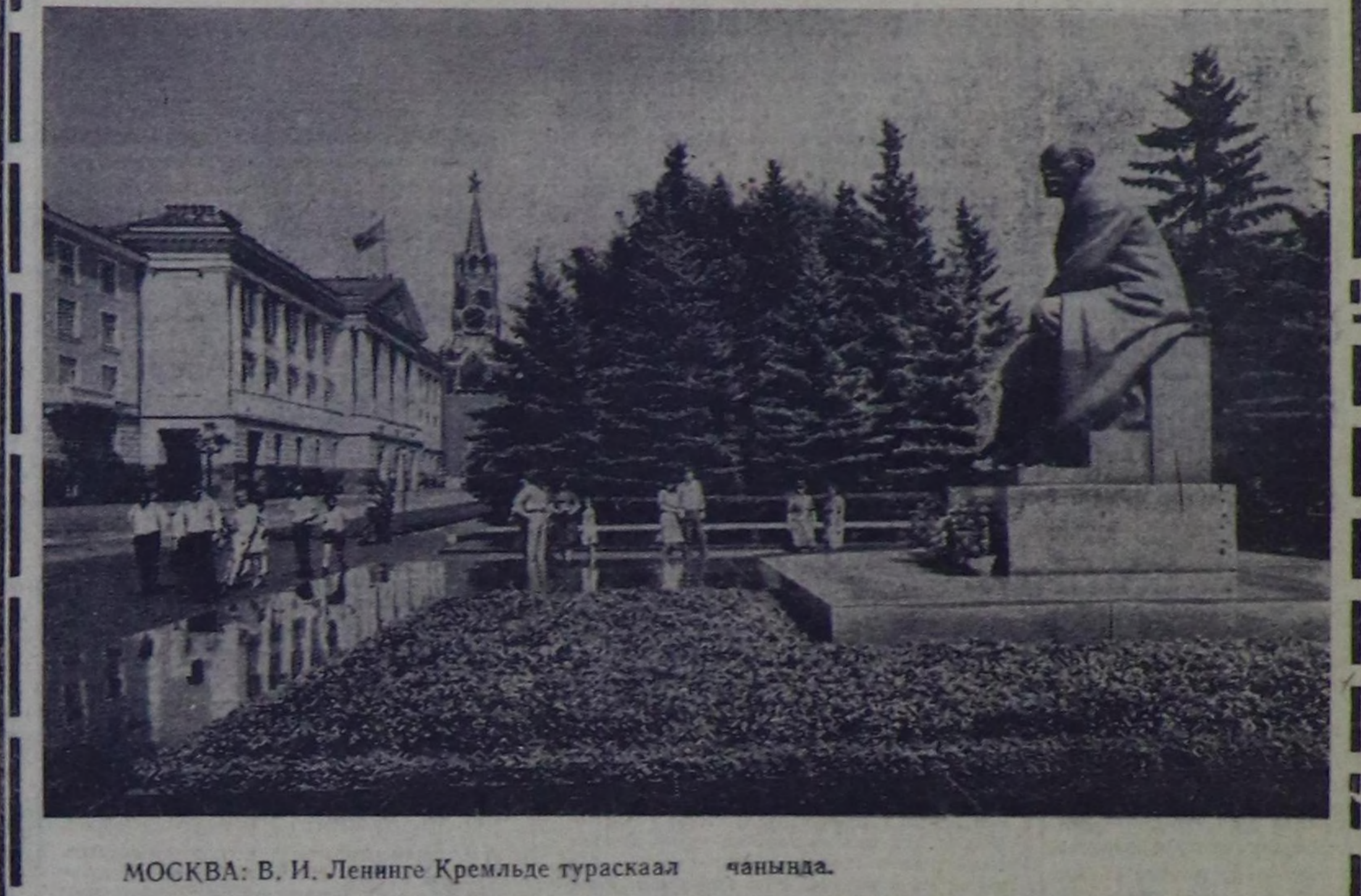
МОСКВА: В. И. Ленинге Кремльде тураскаал чанында.