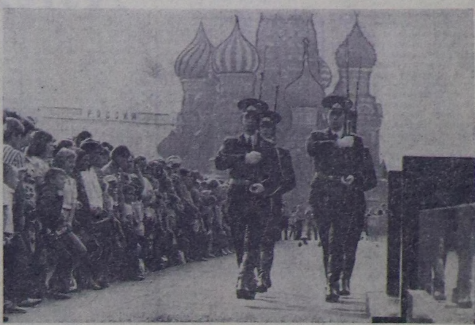
ЧУРУКТА: Кызыл шөл. В. И. Ленинниң Мавзолейиче постуже бар чорууру.