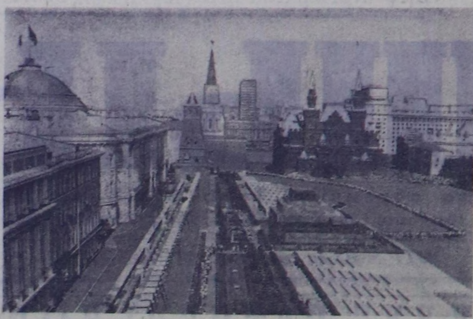
ЧУРУКТА: Кызыл шөл.

Ф. Э. Дзержинский аттыг «Трехгорная мануфактура» комбинатынын партия комитетинин секретары.