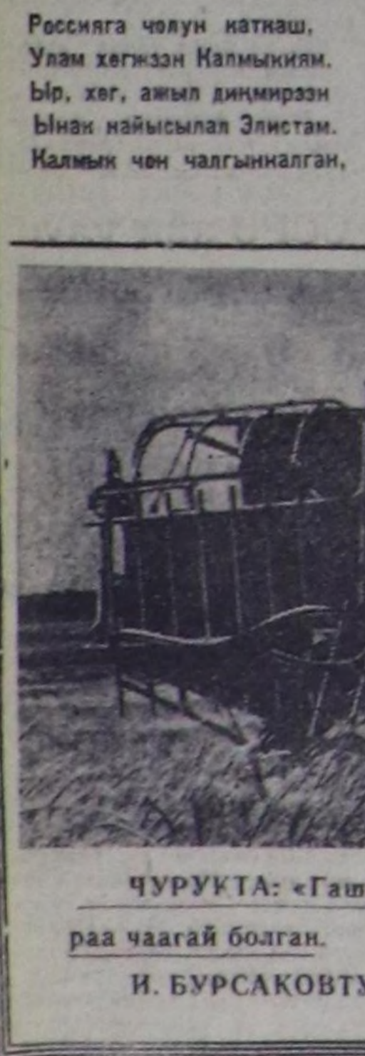
И. БУРСАКОВТУН фотосу.