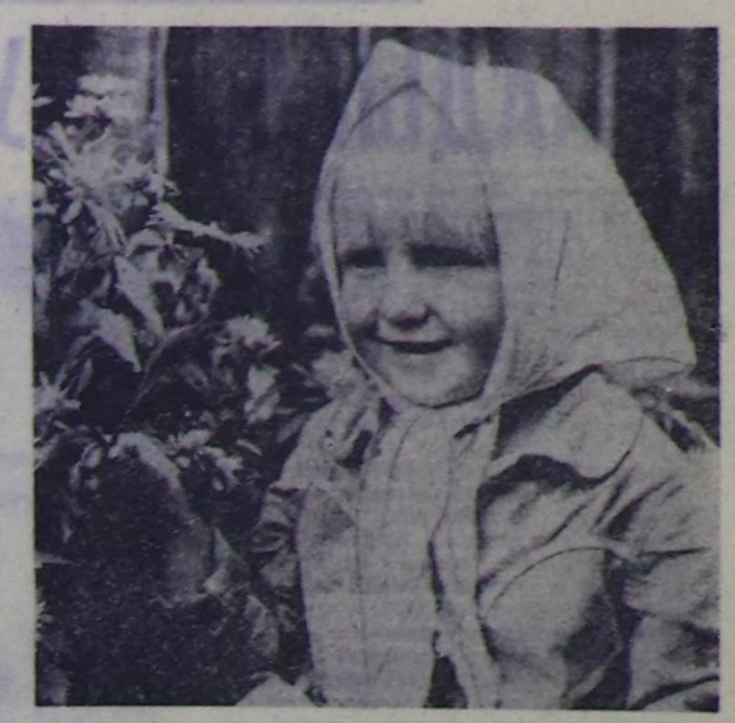
В. ШАЙФУЛЛИНИЦ «Чекстерим» деп фотозтооду.