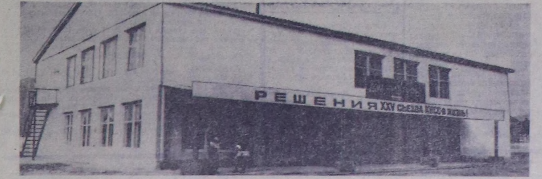
«Тес-Хем» совхозта октябрьда ажылгалга кирген Культура бакыны.