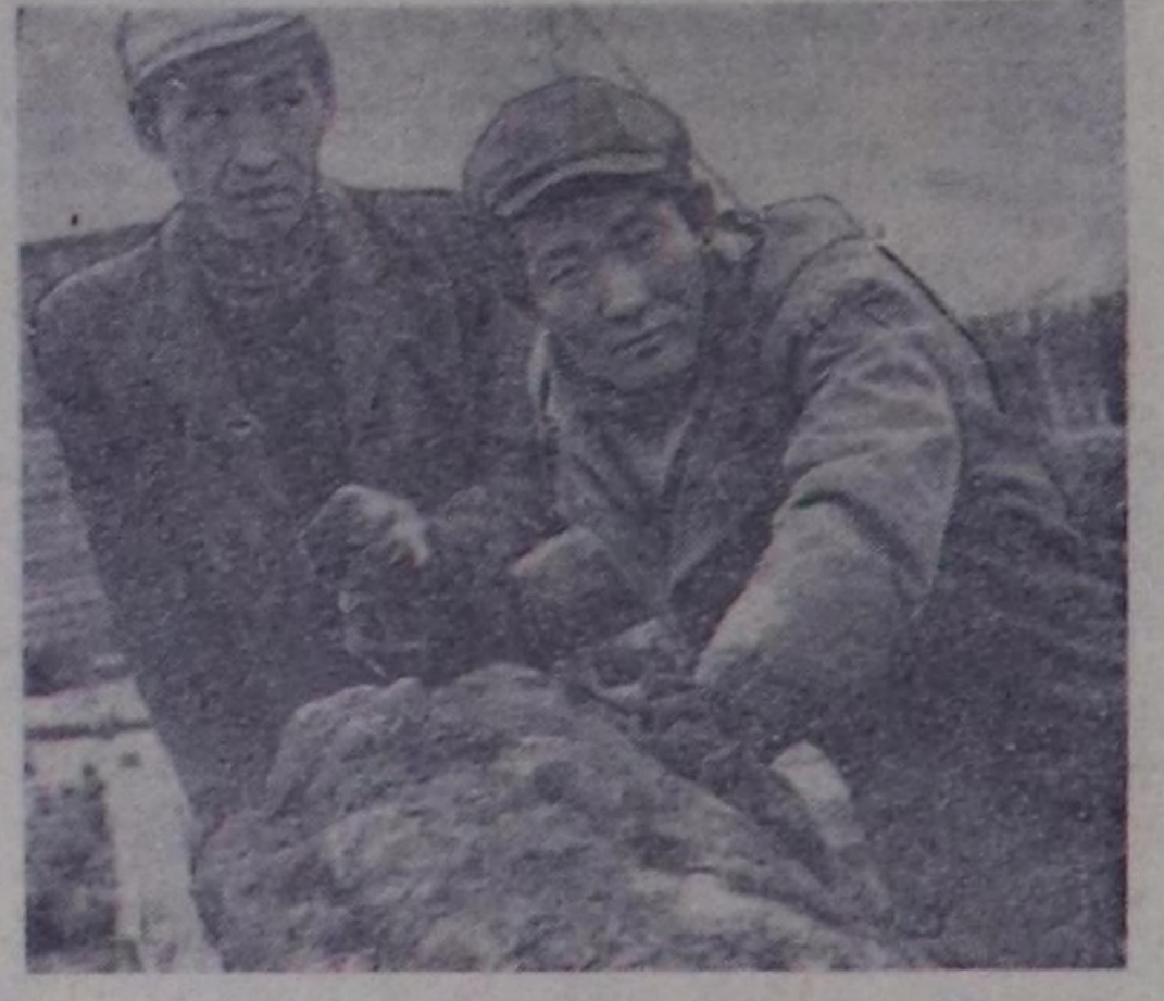
Тыва колхоз туудуг катгыжышыныкы №5 КМК-эм Эрзинде тургузугаанды бөр чаа-ла бир чыл амыл чорур. Бо үеңиң иштинде районга туудуг-суур амылын амылдарыне бистең колхознамын кыргың үчү эвеш эмес.