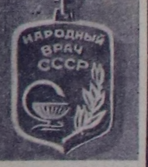
«ССР-ниң улустун эмчиин деп херен демээ. СЭТА. (Чуркту фототелеграф-биле хууза алган).

Совет-индий харызаалар империализмге уду оларын кады демиселит ийн чурттуг удустарын найыралдыга болгаш кады аяктыкты аныгы үндөшүнерин деп, «Нью эйдж» солун айткан. Индия биле ССР-ниң арамында кады аяктыкты чедиринини-биле хоойду турар.