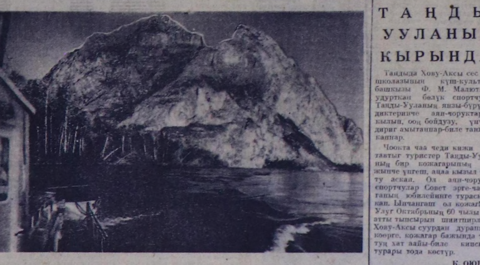
ЧУРУКТА: төрөн Ты-авыстың уран көрүштүг болгаш чурумалдыг булуң-марынаа.

Бистик республиканың бөлүк туристер эркен чайын Моол Арат Республикага аян-чорук кылып, ол чуртунуң чоңуңд амдылары-биле таныжым чорашанар. Бистер Улан-Баторга барган. хоорайның тоодугу музейлеринге иккү-сиккан, чаа-чаа тууларын болгаш 12-ти, 15-ти мыкыраан-нарын соонургадымыс. Улан-Баторга ийи хонган, «Төрөл» дөр турбаагае хашкан бис.