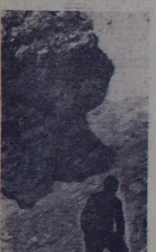
ЧУРУКТА: төрөн Ты-авыстың уран көрүштүг болгаш чурумалдыг булуң-марынаа.

чер. Аргазында 200 хире хевирдиң иштарт, үнүштер, хой чүвүн наскооплар болгаш хоагаанар, куштар бар. Баштайгы иш хонутун соолуңда далай делгелденди 1497 м бедик. Кедровая тайгалың кырыңче үнерип удурутчувус биле чугалган. Арму хемин бажы-биле ашкан, чедер ужурут чорлыңе шак-шак хеминиң кыш чораш биле мей хайташчылар. Хабаровск хоорайдан Дали-перегесинге (Иман) похд-биле четкен. оон ийин Босток-2 деп чаа хоорайга аты-бушту келдиңе. Бракым Чоон чүктүн шыргай арга сымна-ридан быткан Тхетибе хемин үнүп ору чадаг чорунту-вус. Аян-чоруктуң солун хү-нери эгелзоп.