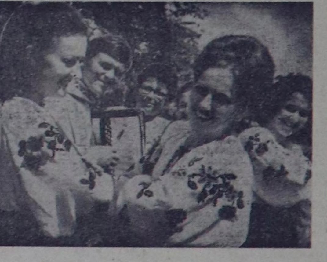
Саранск районун Ватутин аттыг колхозунун агитбригады Ровнода сабылган. Ол агит-бригада орус-аңгыл болгаш рес-публиканың конкурстарының иаш дайып тымыска.