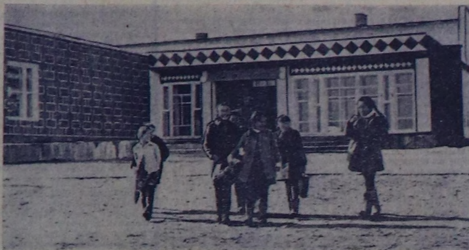
ЧУРУКТА: Чөөн-Хемчик районга бо чылын ажылгалга кирген үш Култура бажынарынның бирээзи—Шеми суурда Октябрынң 60 чылы аттыг Култура бажыны.