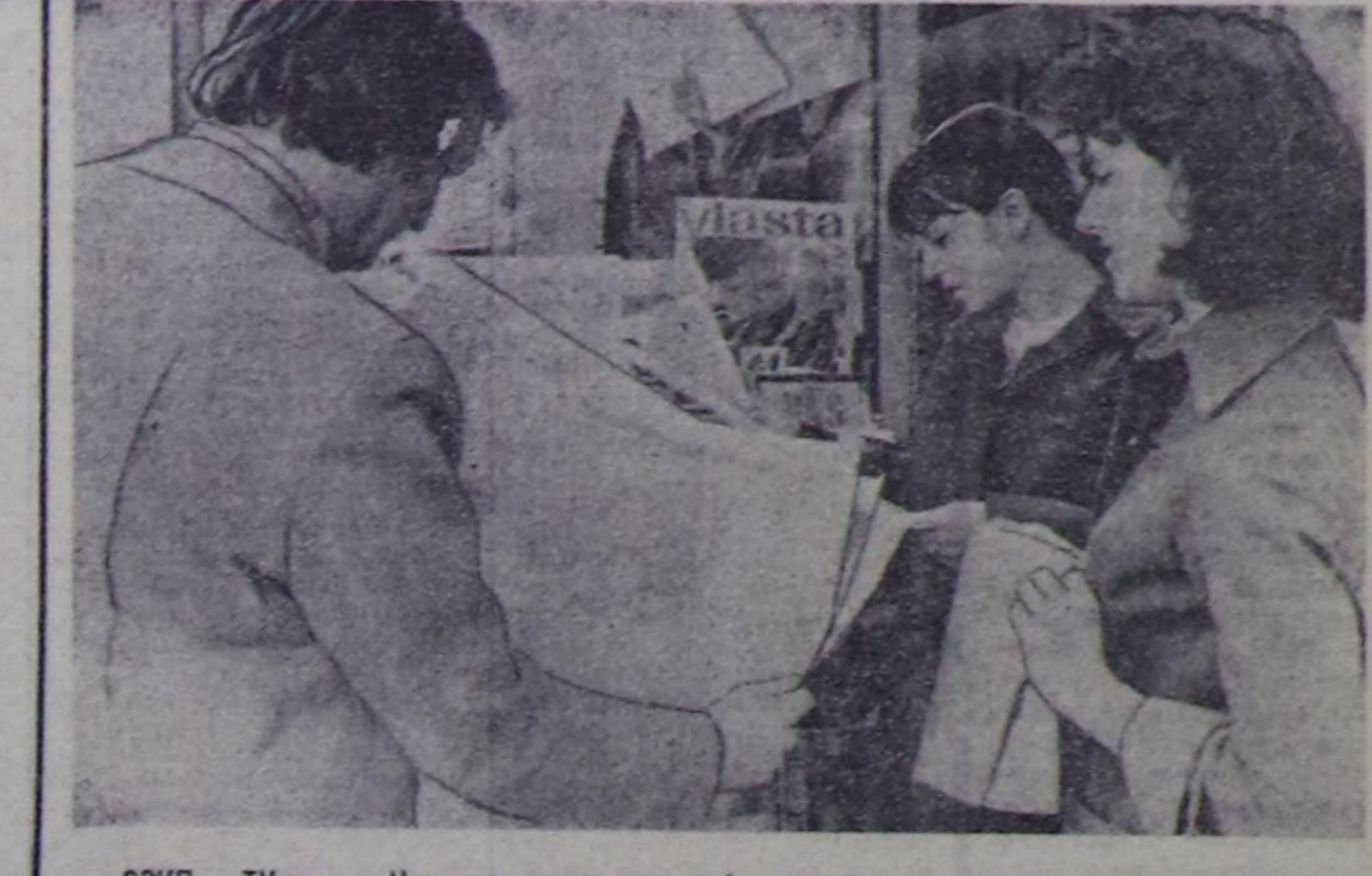
СЭКП ТК-нын Чингине секретары, СССР-нин Дээди Советинин Президиумунун Даргазы, Конституция Комиссиянын Даргазы эш Л. И. Брежневтиң Совет Социалист Республикага Эвелелинин Конституциянын (Ундезин Хойлузунук) төлөвилелинин болган ану бугу улустун чугааламын көргөнүнүн түнчөлөрүн дугайында СССР-нин Дээди Советинин сессиясында илеткел—чехословак хой-ниинин ичкөзгөйинин төвүна. ЧУРУНТА: прагажылар сессиянын ажылынын материалдары-биле таныкып турат.

ЧУРУНТА: тулуда монтажчылар.