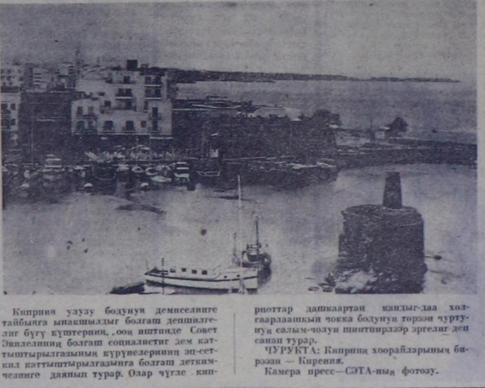
Киприя улусу бодурун демселешиге тайбынган инициалдыг болгон депшигелге бүгү күштерин, оон иштине Совет Эмгекчилең болгон социалистг дем-каттыгымын күрөөрлерин эп-сетки камгаламынга болгон деткам-чегине даянпн турар. Олар чүгө кин-риоттар дашкаартан канды-дда хол-гаараашкыны чөккө бодуну төрөн чурту-нун салым-чолун шийтирлөөргө эргелг деп санап турар.