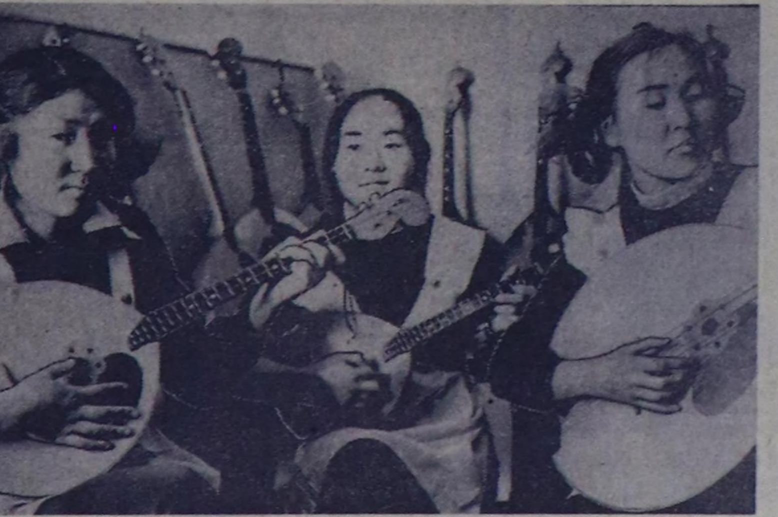
Ондар бодуму, башкылар эртемеңге чүс хуу өөредилгезиниң чедил ап турар.