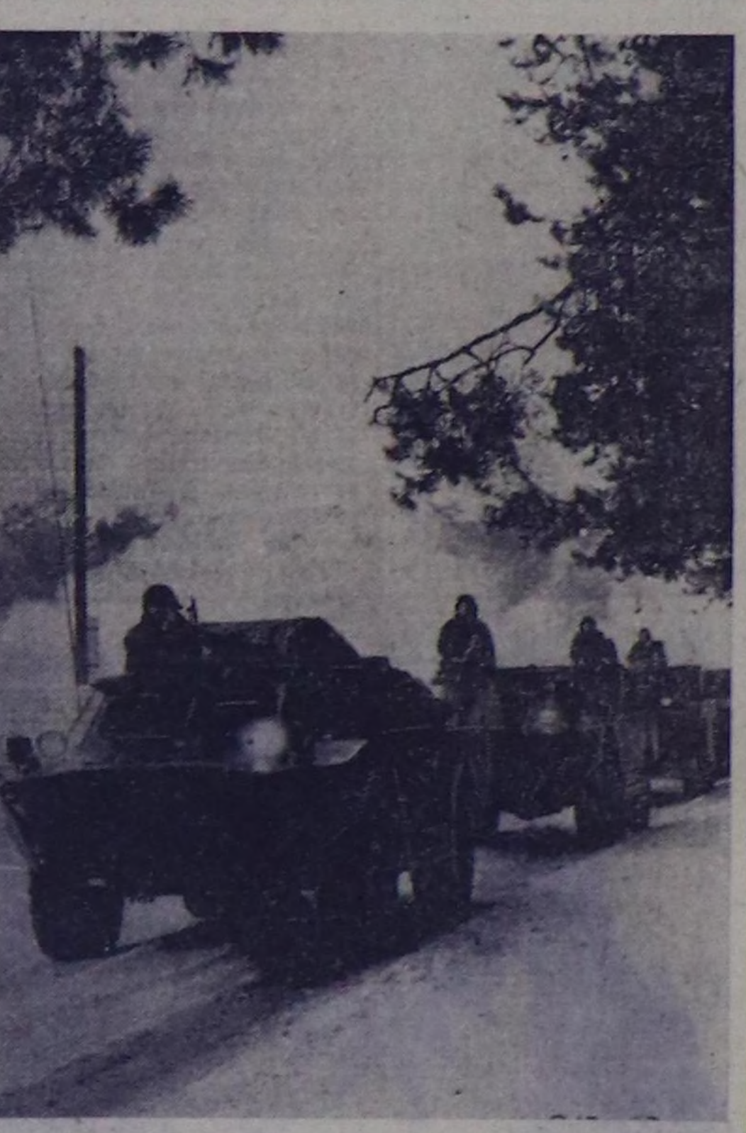
ордуну эжелеп алырынын мерзөөн болган. 1956 чылда крейсерге Топ Шериг-дакың музейиниң салбарын ажалчын. Оюң көр-гүзүг үздүлери «Аврораны» алдармы тоогууңу, 1917 чылда октябрь хүшериниң дугайың чугаалаан турар. ЧУРУКТА: экскурсантыларың крейсер «Аврораны» кырыңче үлүп бар чылды.