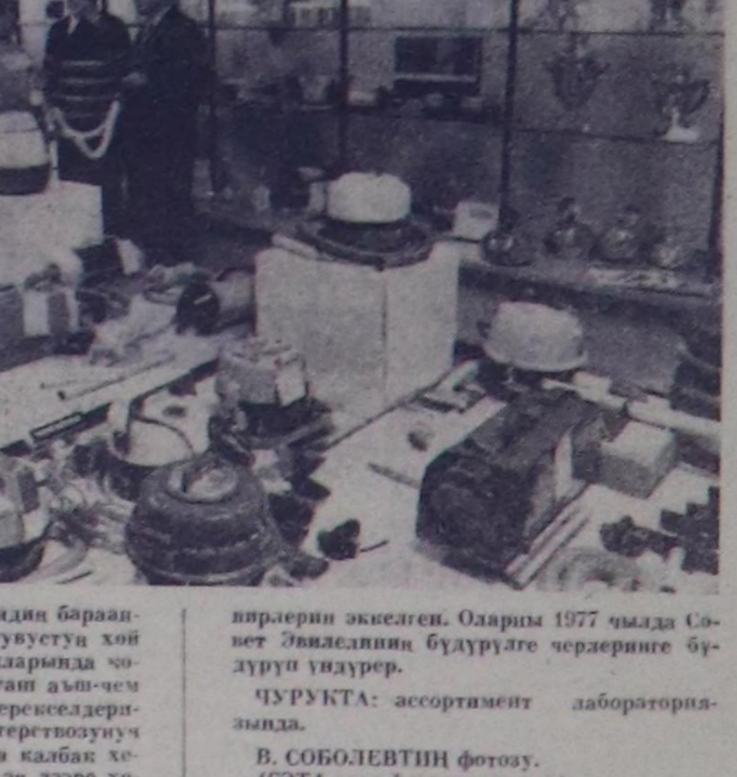
МОСКВА. Машиностройение херекселдиң бараанарын бүдүрерни бистип туртувусту хой заводтарында болган фабрикаларында чо-нүктөүгөн. СЭР-ийч Чык болган азы-чөч үдөтүрүгүнү база амыклар херекселдериниң машина туудуну министрлөөнүч ассортимент лабораториямыга калып хе-регелдин чаа кылдырарының эң дээр хе-

тарынын дузынга даягаш, кварталдар, кудумчулар айы-биле кижизилдиге төмөнгө болган аргалаар чорукту хозарының дугайында база өске-даа яны-бүрү темаларга хурааларын эрттир, чамдык ала-нелериниң сөзүн алаа дин-нап, уругтарын кижизилдигениң сагыш сарып, өскөдөр даягашканын турар. Уругтар өрөөниң амыктыг идеяны өскөдөр турар. Уругтар өрөөниң амыктыг идеяны өскөдөр турар. Уругтар өрөөниң амыктыг идеяны өскөдөр турар.