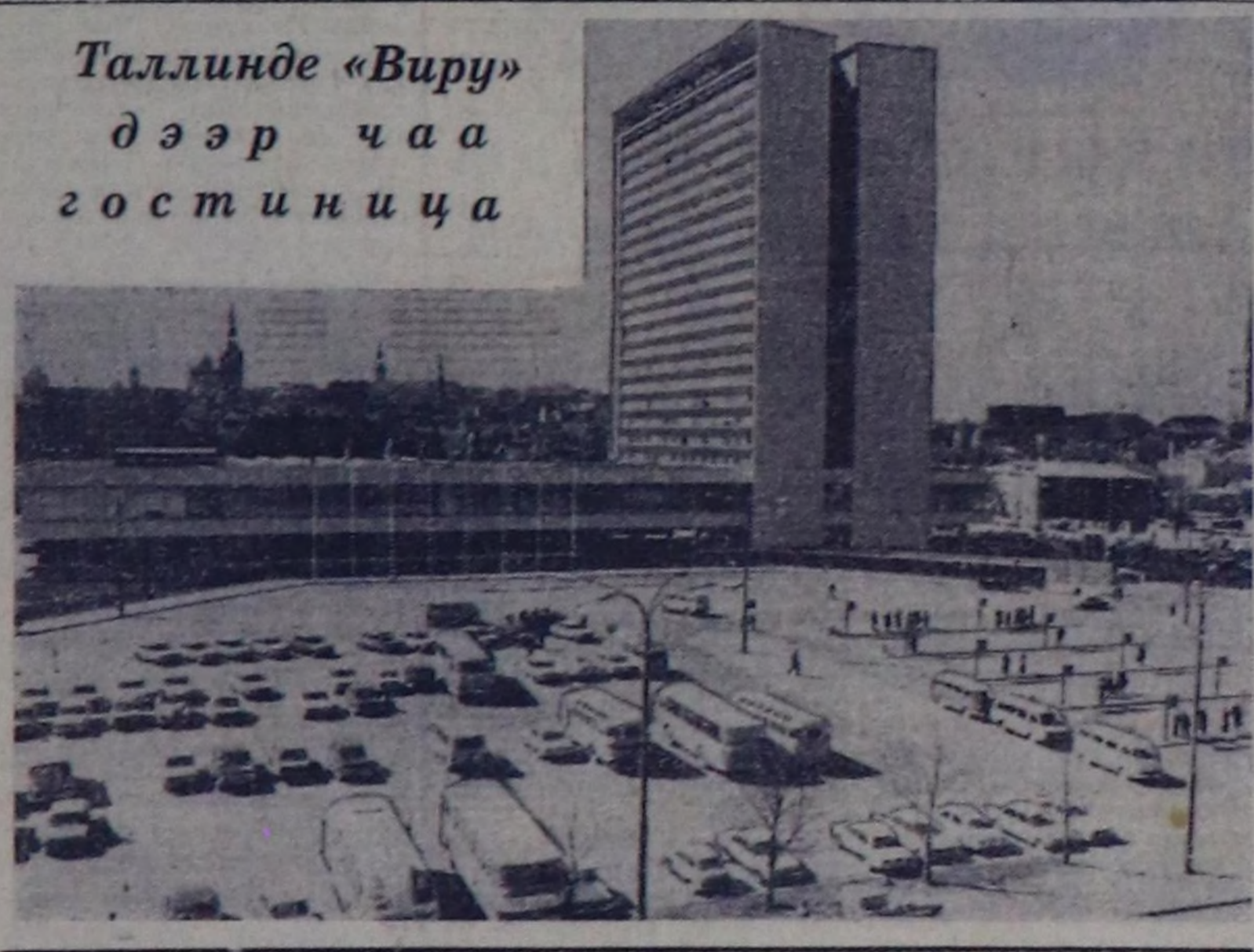
Таллинде «Вирү» дээр чаа гостиница

Көгүдүр сым эдэ черде Көзү өгөтө алтыныптым. Чиркитчирин мөш үдөп, Чикти күдү сүржүп батты.