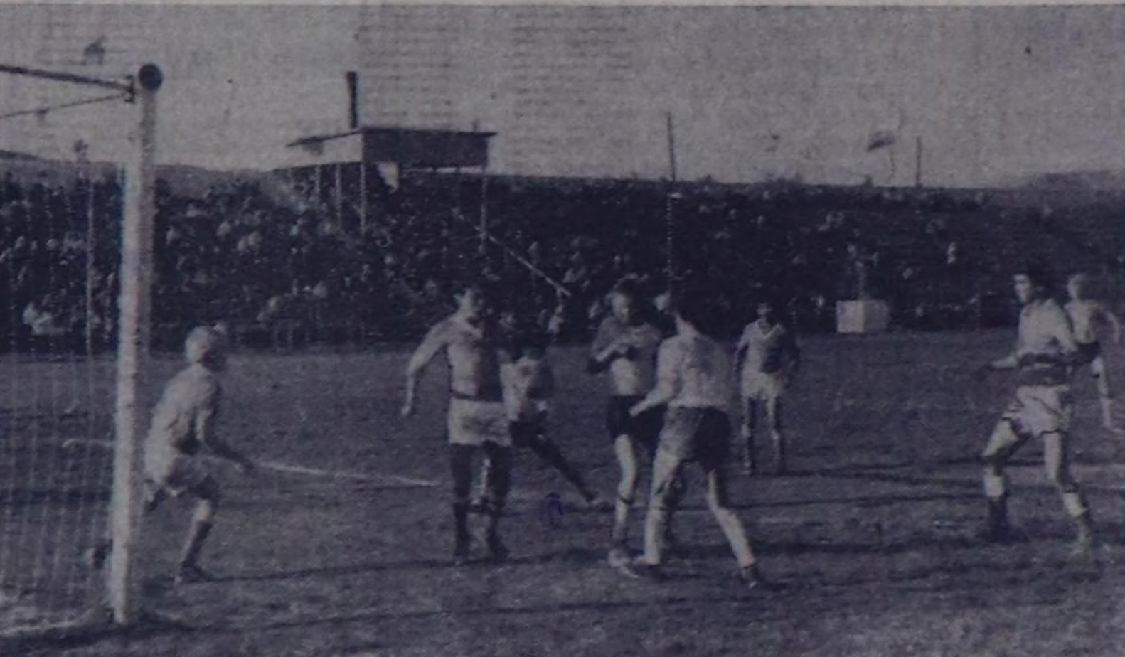
Мартылаага келген «аарыкчалар» Тыванын «Саян» биле Красноярскини «Волга» командаларынын өювүн уагуз солуударынын түнел өюу чоюкта ча болган.