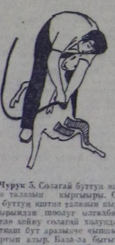
Чурук 5. Солагай буттун иштиң таламы кыргыыры. Оң он буттун иштиң таламы кыргыырыңда шоодут ылгаабас, чүгө хойну солагай холдулаң туткаш бут аразыңче чыттыр тыртып алыр. База-ла быгын-дан эгелөөң, буттун бажыңче үндүр кыргыыр.