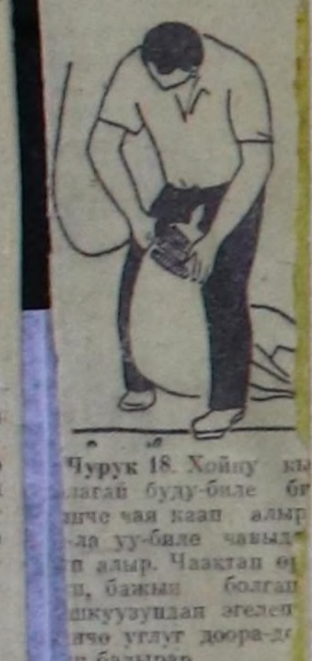
Чурук 18. Хойну кы-лаңга бүүдү-биле бө-дүрчө чыа каап алыр-лаң уу-биле чавык-тып алыр. Чыдаңгы өң-ти, бажың болгаш шкууңдуң өтөлөп чө-ло улаңт доора-до-ра бедилер.