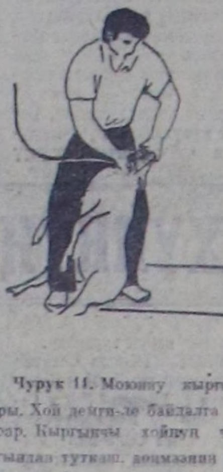
Чурук 11. Мону кыргы-ыры. Хой дөңгө-ле байдалга ту-рар. Кыргыкчы хойнуң тээ-гылаңда туткың, дөңгөчөгө кыргыкчы өйтүр тыртып алыр. Оң төш бажыңдан боостра-ың оң-бо таламы дургаар кыргып өскөдөр. Чыдаңгы хой-ларын илангыч мерикөң уи-саалың мойныңыңче көштө-ри тыртык болгашыңда хө-ңгөң ийиленип келер. Кыргы-чының хачың ооргане улаңт болур.