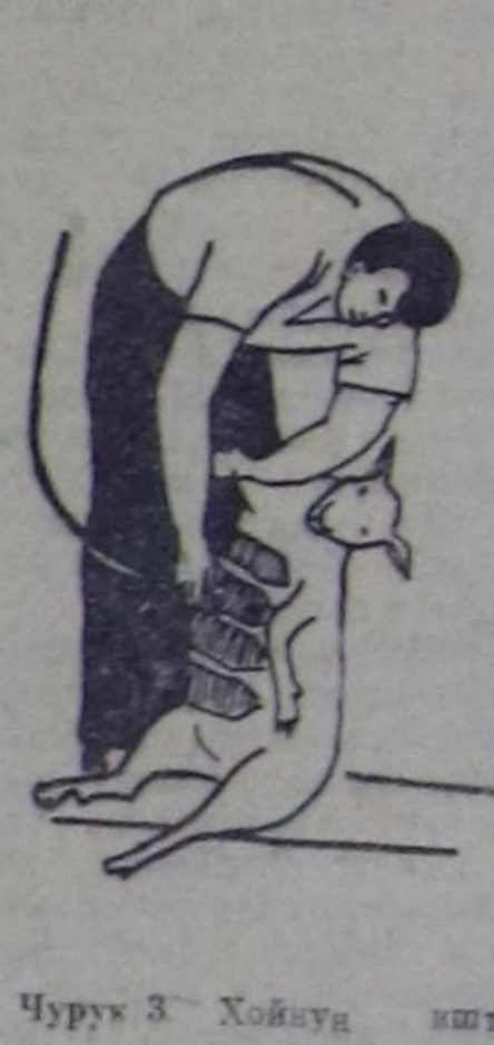
Чурук 3. Хойну иштиң кыргыч төдөрүлө. Кыргыкчы өдүртүр ийи алган хонун он таламыңа кээр болгаш хойну бодунуң солагай дөңгөчөгө чө-лодир тудуп алыр. Оң сола-гай талама улаңт доора-доора кыргып бедилер. Кыргыкчы өң үеде хойну он таламы хол-дула бодунче чыттыр тыр-тып алыр.