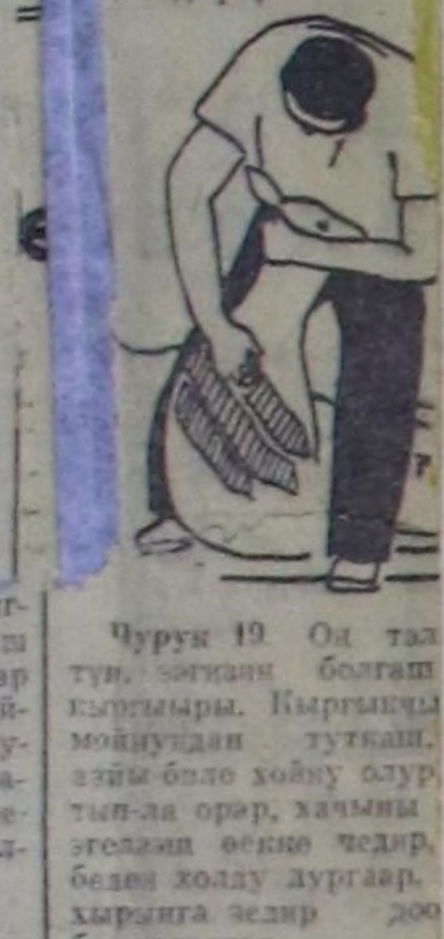
Чурук 19. Оң та-ламы бажың болгаш дөңгөчөгө кыргыыры. Кыргыкчы хойнуң бүүдүнүң дөңгөчөгөң азы-биле хойну өштү-түрүп өрүр, хачың дөңгөчөгө өңдө чөдир, бажың холду дургаар, хачыңга чөдир доо бажыңталар.