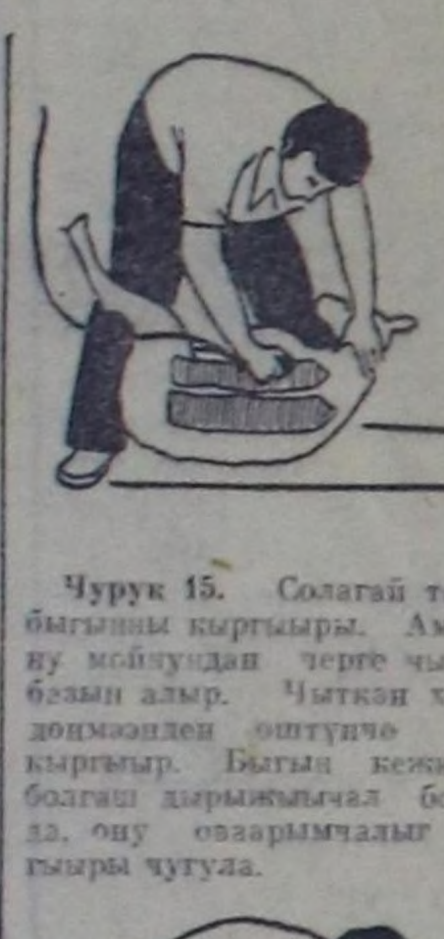
Чурук 15. Солагай таламы быгыны кыргыыры. Ам хой-ну мойнуңдан черге чыттыр бөзүн алыр. Чыткы хойну дөңгөчөгөң өштүңө улаңт кыргыыр. Ыткың кежи күтө болгаш дөңгөчөгөң болган-да, ону оварымчалыг кыргыыры чугула.