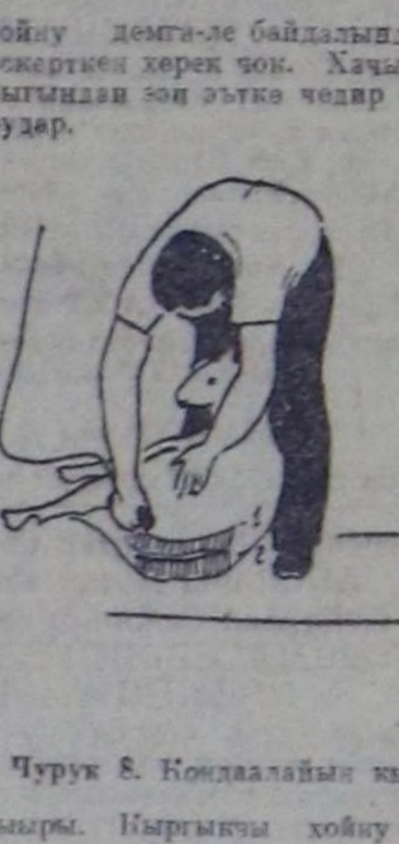
Чурук 8. Көңдөлаңы кыргыыры. Кыргыкчы хойну он таламыңа өөдир чыттыртып, бажың бодунуң оң таламы дөңгөчөгө сымартаңдыр ийи алыр. Кыргылаңың кудуруктан оор-ганы дургаар чорудар. Мону кылыраа баштай кудурукту кыргып алары чугаажок.