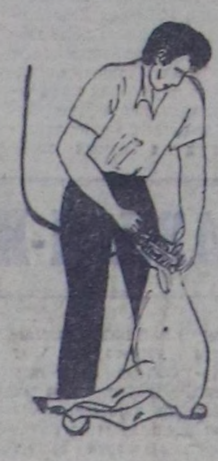
Чурук 9. Бажың кыргыыры. Хойну ковайтыр өдүрткөң, дөңгөчөгө чө-лодир алыр. Кыргылаңың дүңгөчөгөң чавык-ты өрү чоруткың, кулаңтар аразыңга чөдирер.