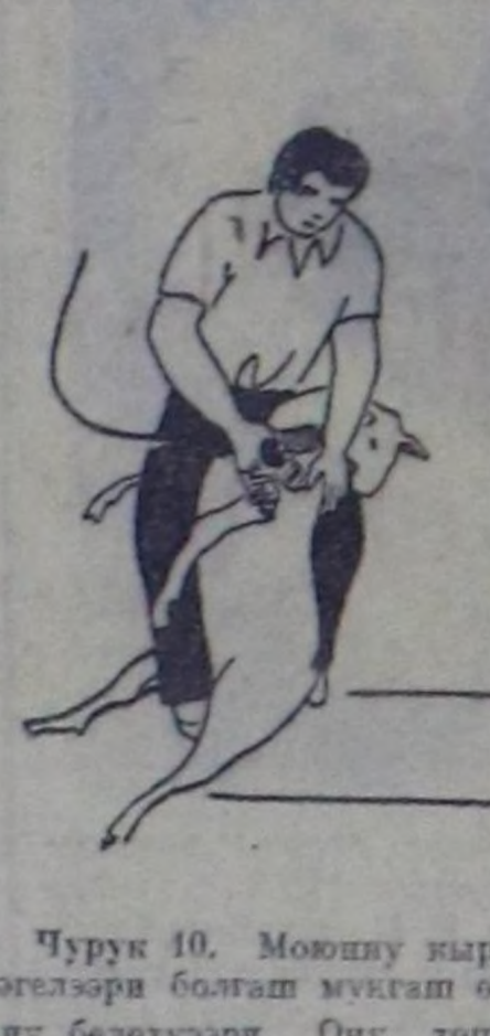
Чурук 10. Мону кыргып эгелөөң болгаш мунгаш өдү-ну белеткээри. Ону төштөн эгелөөң. Ынчан хойну он та-ламы холу-биле бүүдү кыргы-чының бүүдүнүң аразыңга ту-рар. Кыргыкчы хойнуң мойнуң төшө-биле бодунуң дөңгөчөгө чыттыр иткөң, чарып кыры-лаң хойну бодунче чыра тыртып алыр. Ынчалгаш өң-ти төш бажыңда өтөлөп хөң-дөрбөжө улаңт доора кыргыыр.