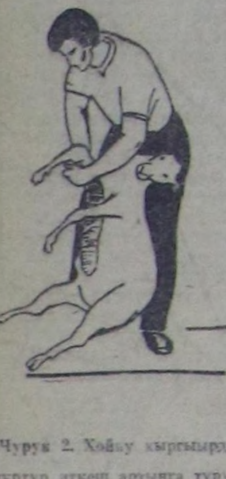
Чурук 2. Хойну кыргыырыла, күртүр өткөң аразыңга туруп алыр. Баштай-ла төш кыры-ның дүктүрн кыргып эгелөөң, он сөңгө оң таламы бы-гылаңга чөдир кыргып бедилер. Ынчан хойну бажың ковайтыр улаңт алыр.