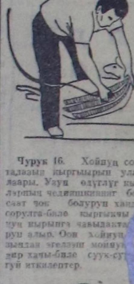
Чурук 16. Хойну солагай таламы кыргыырын уламы-лаары. Маун өдүлүгү кыргы-лаңгыны чөдөңгөңгөң болгаш сөңгөң төш бодунуң ханды дөң-гөчөгө бүүдүрүчү кыргыкчы хой-нуң кыргыкчы чавылаңга ийи-туруу алыр. Оң хойнуң чавы-лаңга эгелөөң монуңга чө-дир хачың-биле сүүк-сүүк ку-лаңгы иткөңгөңтөр.