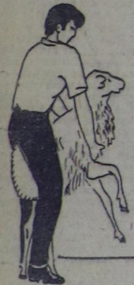
Чурук 1. Хойну тудуп, кыргыыр черге төдөрүлө, сөңгө өмдөнтөй туруп алгыш, мой-идаң ийи холдан көдүрүп кырга эңтиг. Хойну бедилер өдүрөгө, боду-ла ийи буттан алаңтай бээр.