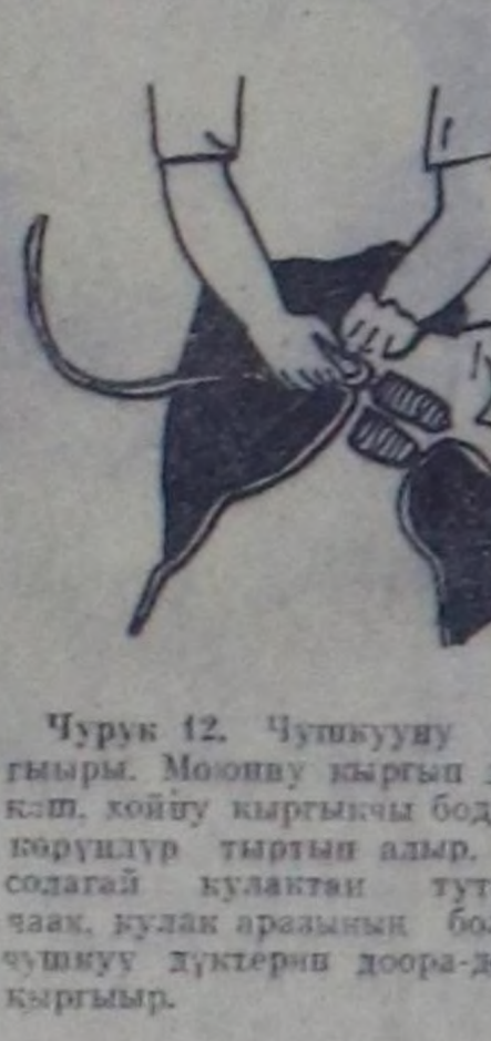
Чурук 12. Чыткыуу кыргыыры. Мону кыргып доо-скөң, хойну кыргыкчы бодунче көдүрүп тыртып алыр. Оң солагай кулаңтын туткаш, чык, кулак аразыңың болгаш чыткыуу дүктүрн доора-доора кыргыыр.