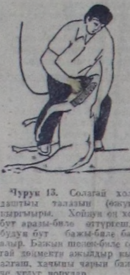
Чурук 13. Солагай холдуң дөңгөчөгө таламы (өжүнү) кыргыыры. Хойну өң холуң бут аразыңга өштүрөң, он бүүдү бут бажың-биле бажың алыр. Бажың төшө-биле сола-гай дөңгөчөгө амылдан кылаң алгыш, хачың чарың бажың-че улаңт чорудар.