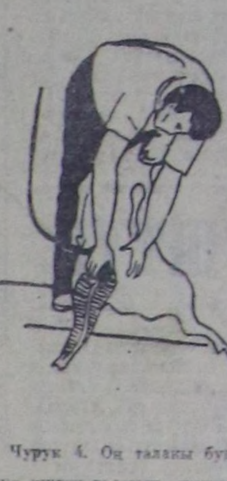
Чурук 4. Оң таламы бүү-дүнү иштиң таламы кыргы-чы. Кыргыкчы хойну бодунче чө-лодир тыртык, хойну со-лагай бүүдүн бөзө-биле атка-ар ийи алыр. Оң сөңгө быгын-дан буттун ужуңче улаңт кыргыыр.