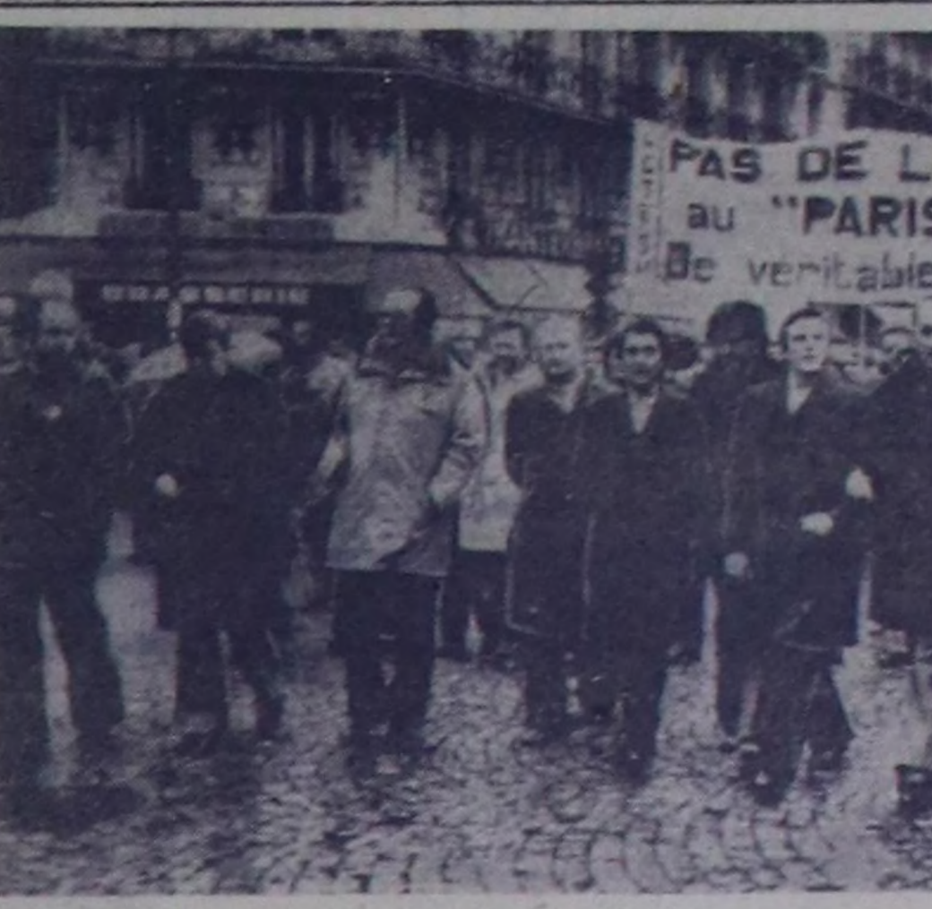
Франция. Ажилчы чоннарның колонины (чуркита) Согу везилдан Операшелунге чедир Паризтин төп идуумчулары-биле эркен... Улуг Октябрга турсакааткан

БЕРЛИН. Политика, эртем болгон техника билигери неперид «Урания» инитиде... Улуг Октябрга турсакааткан