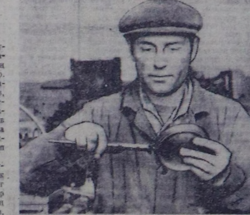
Мастер — бөдүрүлгедө кол кижини МЭЭН САНАЛЫМ

Совет эрге-чыгарып чылдарында Тывалын хөмүр-даш улутпуну ээен төгжөөн. Чүгө чыгарып чикти ап каравалар: 1945 чылда республика-ка казып, тым турган хөмүр-даштын төмөткөн бөгүгө төгжөөн чүзү ажык катан эвөөш бооп турган. А 1977 чылда ол сан — 770 муң тонна ажык болур. Бир эвес Тывала дөргөн чылдары шахтёрларын челин чөдөр — күскун-хай, а транспорт — тергелгит аяк бооп турган болза, бөгүн — ЭК-1,4,6 болгаш ЭШ-10/70А экскаваторлар, чөдөр уттар 2СВШ-200Б станоктар, зар чүк сөөртүр БелА-540 деп самоваллар ажилгалта турар. Бо бүгүлүгү түнөлүшө бөдүр 1945 чылда