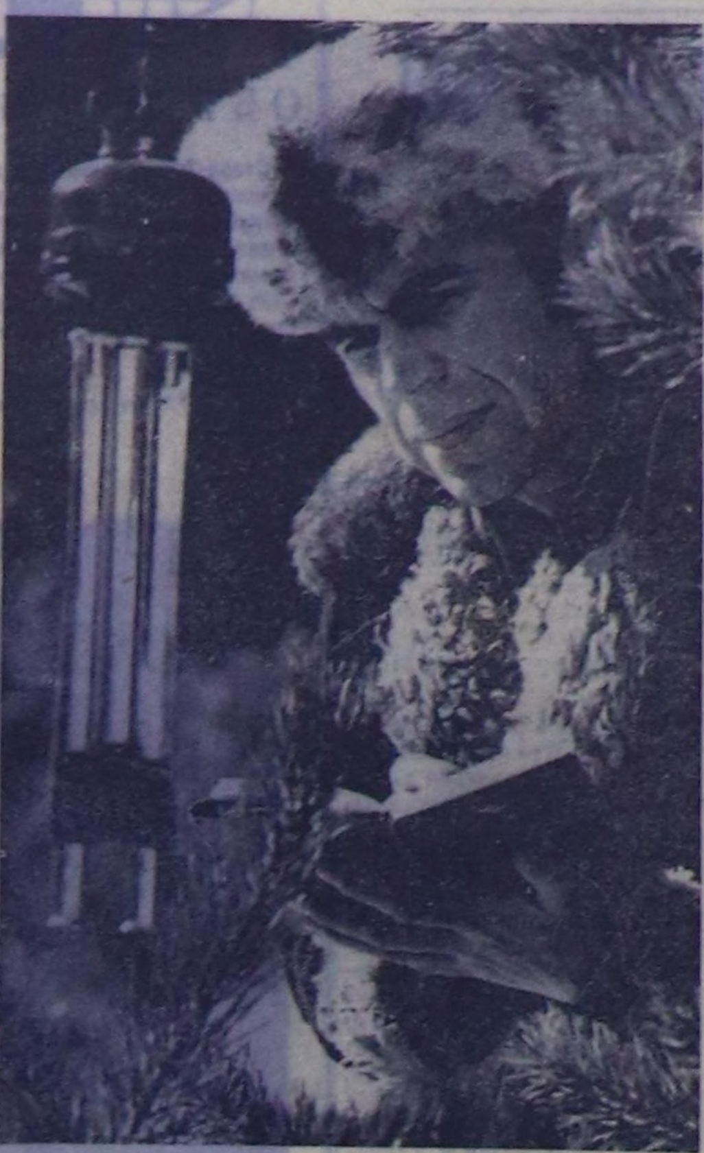
ЧИТА ОБЛАСТЬ. Читанын геология эргеледини Зайбалыде комплексити геофизика экспедициясы ам областын сонгу талааи райондарын черини иштин өөрүнүн хероаженир турган Удоканын чекти, бокситти, хөмүр-дашты, демияр черини шимжени аларын эгеледини болдунар арганы боор.

Геологтар аэрогеофизикти тырттырышынын кылып, чер адынын ишчилелерин чордуу турар. Адыланг медээлерге үндөшкөн турган, БМ-га хамаарын турар девекээрлерин геологтук чүрүн кылып тургууар алаар.