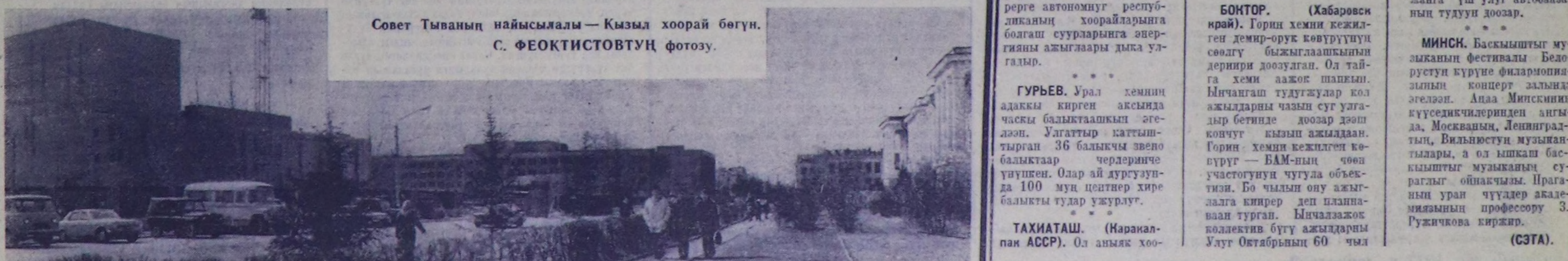
Совет Тываның найысылма—Кызыл хоорай бөгүн.