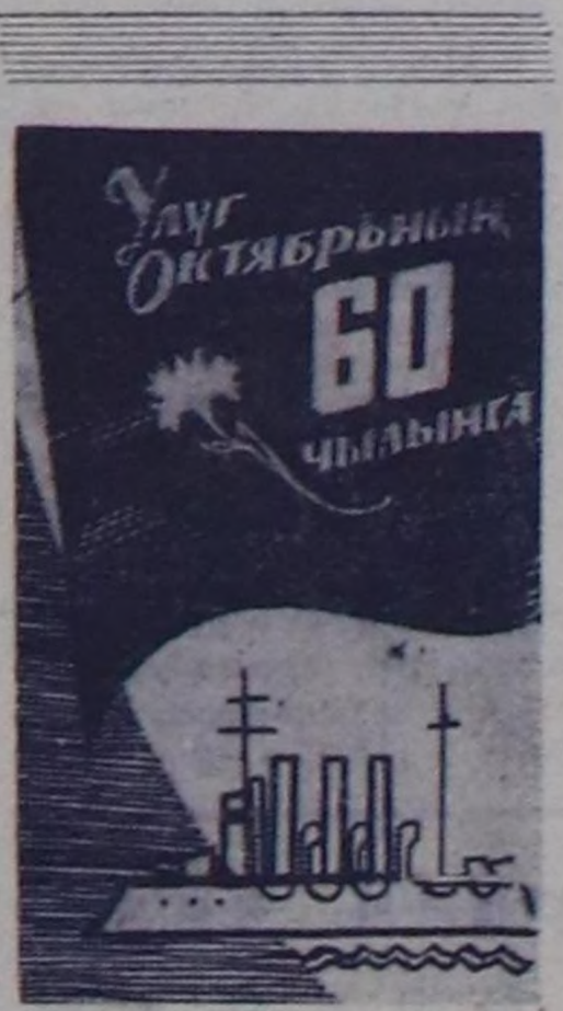
УЛУГ ОКТАБРЬНЫҢ 60 ЧЫЛЫНГА

Улуг Октябрьниң 60 чыл оюнга алдар болдурган социали-ст чарышты бедиди деңгелди, дээштиг калбартырын хан-дыраы—партия организацияларының чугула сорулганы. Күш-ажылыч коллектив бүүдүргө шалпычы ишти тодаргай организастап, доктаамал контрольдоп, социалист чарыш-ты ууртурунча чеди алган дуржылганы быжыглап, бо та-лазы-биле ажылдыг аргаларын улам сайыраңгайыңдары эргекчө чугула.