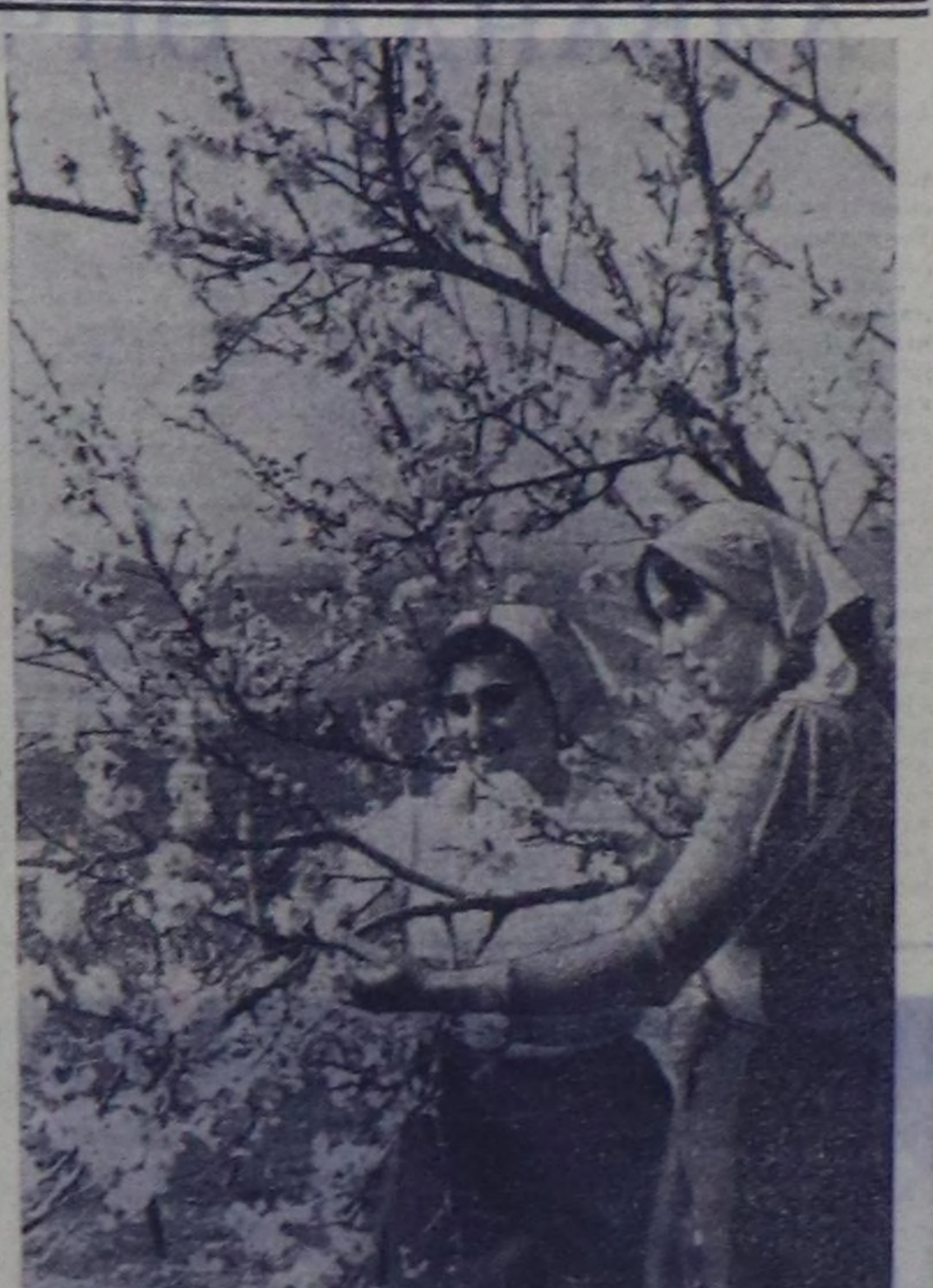
Грузин ССР. Кат-чимис өстүр аял-агыларнык сар-тарында чыны аялчылар калбарган. Одурулар арасы бол-базырадыны, ылыштарны профилактиктик ажаалдазын дүг-ген темпери-биле чоруду турар.

Чыл санында мартта Япониянык шунту уруглары ойнаар-кыстар байырлары дем-делген эрттери турар. Ол хуру бажыну бугуе гусейн кылган ойнаар-кыстары де-леген, аш-оорунге улуп бээр-биле аш-чөм билестер. Чо-гуу байырлардын кажы ты-ныгына тода билдинес. А кылча-да ону шаанда биле болган дөңгөлүк турган саады дурауларын тыныктап саады дурауларын Чынык март-тын ачкынык кылган алганы саады дурауларын хемче ойнаар-кыстары бажы болган кижиге турган шунту багы чүдүлөр чиди чоруй бөр турган ден улгын берген ойнаар аниктарга тайылдырлап чоранинар. Иччала-даа чороти ол саады дурау-лар ана кылган ойнаар-кыстар-биле солуттуган болган оларны хемче октаве апар-ган.