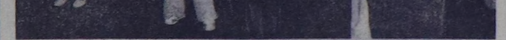
МАЙРИД. А. Суарестин чазак Испан-лядың Коммунист партияның ажалы болдурамыны дугайың чарлаан. Ол болза чурттуң бүгү-ле демократыг күштериниң уаугу тилектеги.

ЧУРУКТА. Мадридте чуртаткылар компартияны ажал болдураң дугайында диниялтың байыр недирип тур.