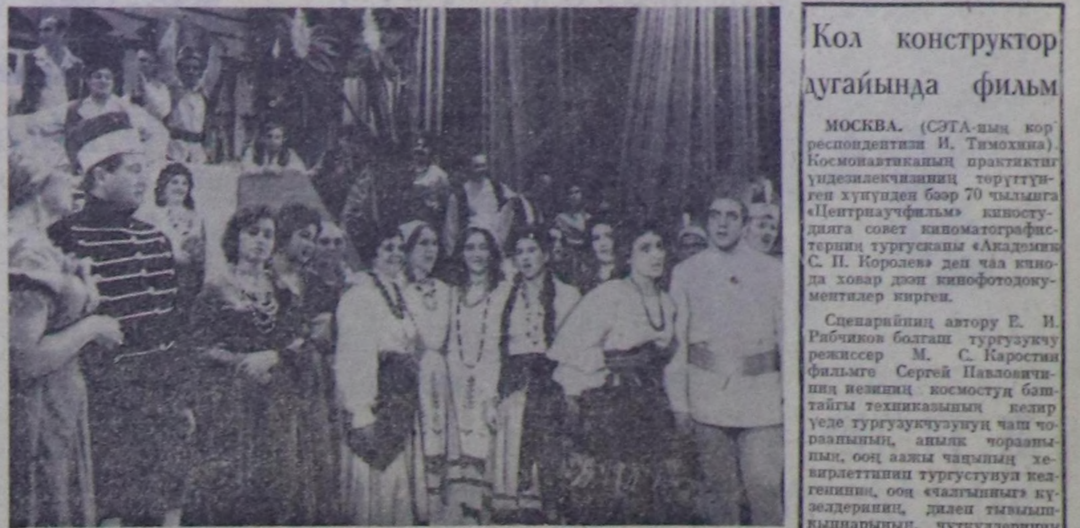
ЛИТВА ССР. Клайпеданын улусу опера театры республикада эжеке суралып боу берген...