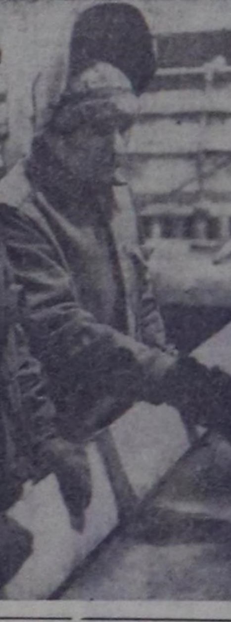
А. ЗАПЕВНИҢ ФОТОСУ.