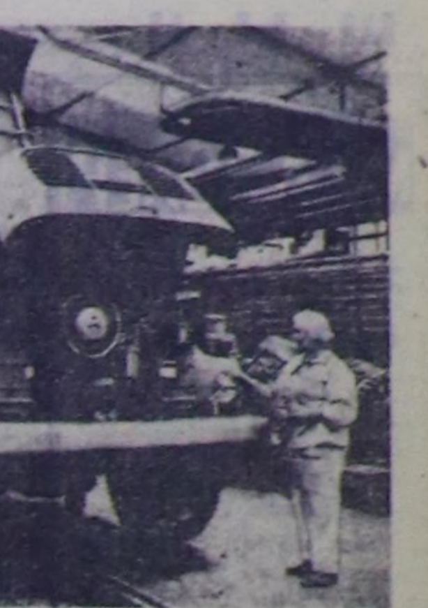
«Татра» аттыг чехословак...