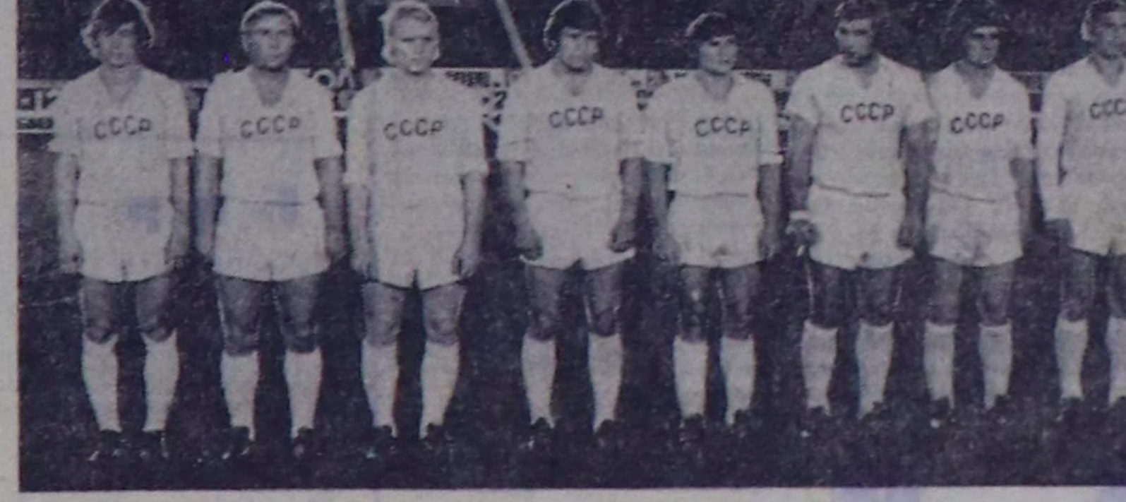
ЧУРУКТА: Даг-Алтай автономнук областың концерт-эстрада бюрозунуң ыраажымы...