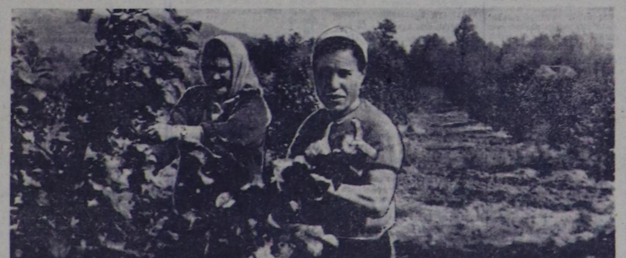
Бо чурукта Чербинин кат-химствег салында чагай өскөн раискаларын ажилчыларынч ажал турары.

Чербинин арга-мыш ажил-агымын коллектив беш чылдыг планын даалгаарын чедикшикниг күөсөдөр дээш шалычы ажиллап турар. Ош ажил-чылары Чербинин де-вискээрине кат-химстерин ашмаа остурер салтың шолуң бо чылын 80 га чөдөр калбар-каныр. Ында тараан виктор-иниң, маданын, раиска-ның болган ош өске-даа кат-химстерин үнүжү эки болуп, бо күзүн бедик дүжүттү болган. Ажыл-агымын ажил-чылары ол шөлдө 120 га чер-де чыжырганын база остуруп агаалын.