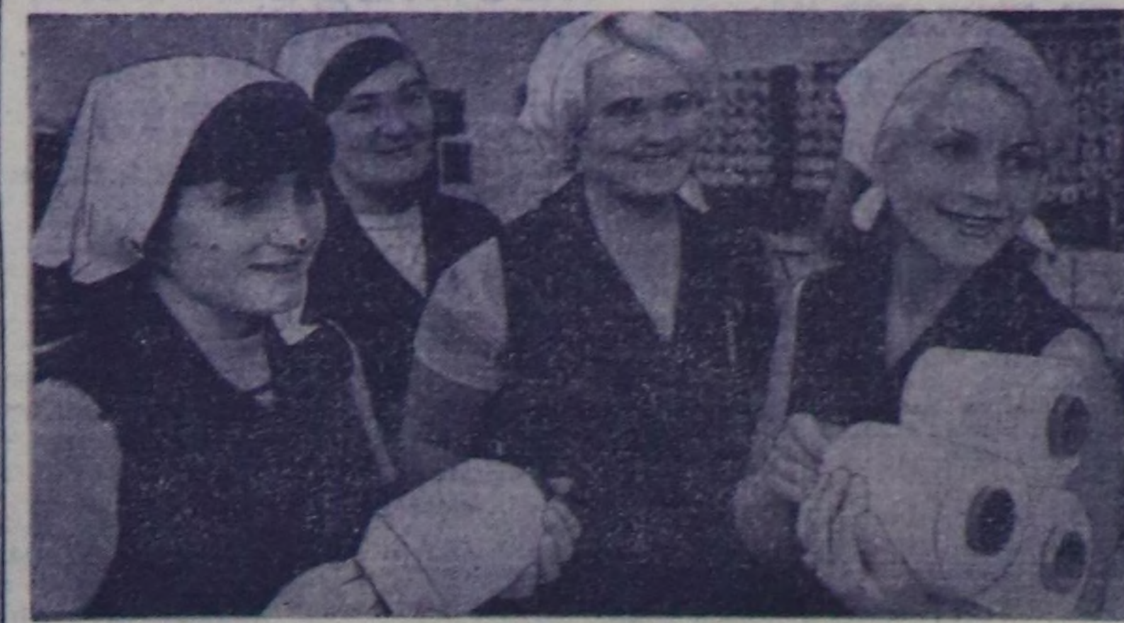
АЛТАЙ КРАЯ. Химиктиг волоконун Барнаулда комбинатының коллективи күш-ажылычы улуг тилгени чедип алган.

Бойдус-биле хиним тудуш: Борбак дамды—арыг сугга. Адыш оюу кара хөрүтү. Агаар, хунге өрелги мен. Арга-ла бар түвө болза, Бүгү турган ортемчейин Артын калыр салгамыга Бүдүп хевээр сууксаар мен. Бажымга-дуза сыла албас, Бардам кулаз, аас этпей, Дек-ле шыны согтеп көрей: Дээр-ле ыры, шүлүүм Авам болган төрөз чери Алдаржым чорур болзун!