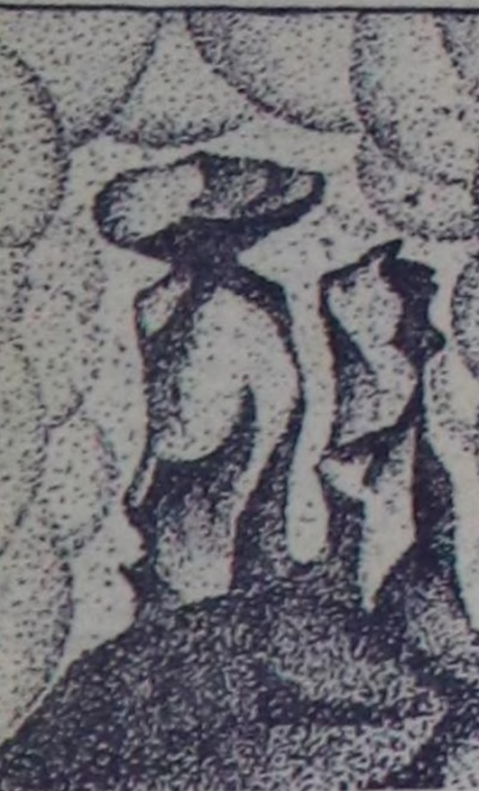
Хаваларым топтап көөрге Калдыг дүрү миңа чок дээр: Аннар, куштар, араатаннар, Аксин ашкан Амырга-Моос...

МАНДАЭН 1:0 сага уткап. Ычканаш Морреалга болур олжың оюннарын түнел маргылазынга киржир өргөни чаалап алган. (СЭТА).