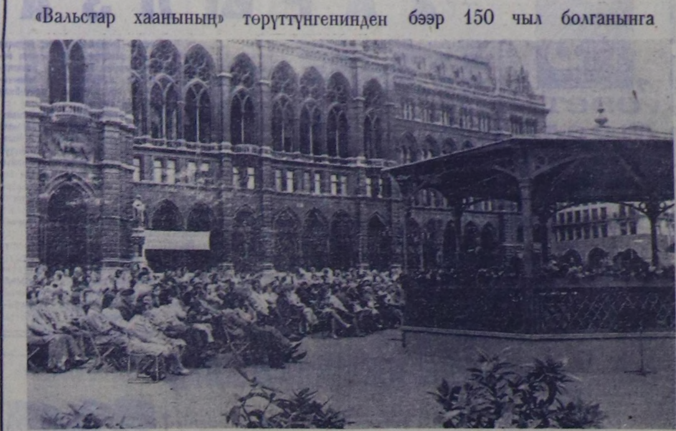
Штраустуң төрөэн чурту—Вена юбилейин төлөтпө-биле демделген турар. Найсылтадык хөгжүм талазы-биле бүтү амыдыралы ол юбилейин калбаа-биле байлап турар. ЧУРУКТА: Штраусту дидип турары... Юбилейиг дегелеген аймакча Вена улаанышкы бажынынын мурунда төлөк композиторун суратугы чогаалдарын күөседип, концерттерин көртүзүп турар.

деп турар. Ф. Энгельс ол шини политикатгы улаанышкыны баштайгы немес драма деп бижээ.